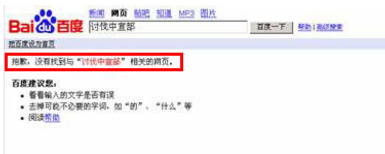
(图7、在百度搜索“讨伐中宣部”出现的却是“抱歉，没有找到与‘讨伐中宣部’相关的网页”。)