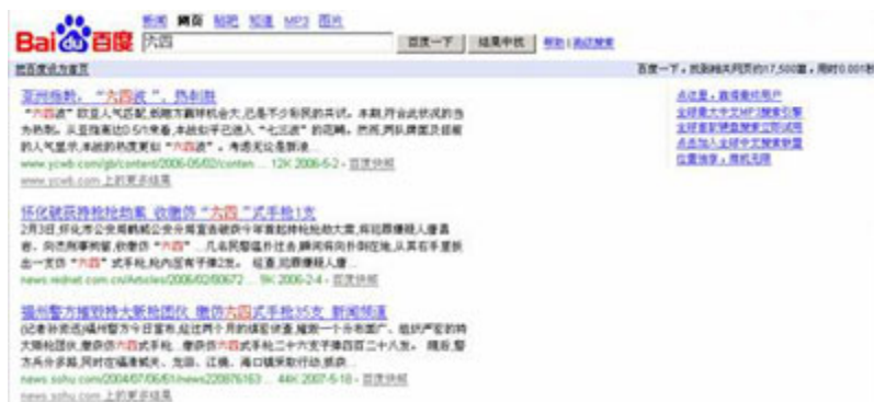
（图14、在百度搜索“六四”显示“找到相关网页17,500篇，用时0.001秒”。）

在百度搜索“六四”后，显示搜索结果为“找到相关网页17,500篇，用时0.001秒”。（见图14）