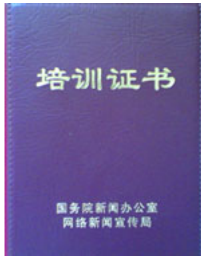
（图2、国务院新闻办公室网络新闻宣传局颁发的“互联网新闻业务培训证书”）

为了确保对网络媒体的控制，国务院新闻办采取的一招就是对网络从业人员进行思想灌输式的培训，使网络从业人员在以后工作中时时进行自我审查，不再发布敏感信息。并进行考试，合格者颁发“互联网新闻业务培训证书”（见图2）。这样的培训已进行了20多期，每期50人，每次培训时间5天左右。这类培训是对国家直接插手培训监控人员，利用互联网商务公司白领技术职业员工的自律和协助，来达到延伸政府监控网络的目的。