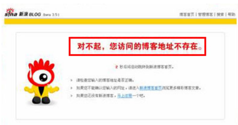
(图19、在新浪博客发表“九评共产党”后博客被封。)