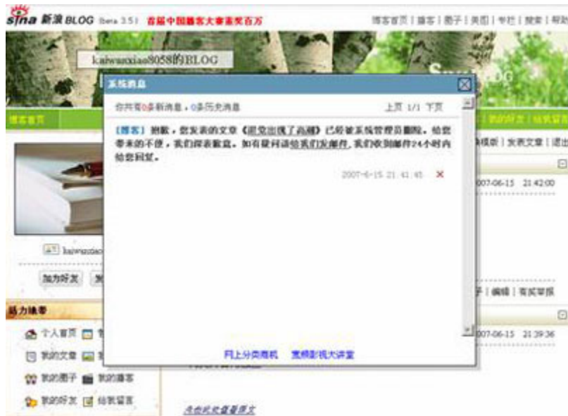
(图12、4分30秒后被删除，收到系统管理员发来的系统消息。)

4分30秒后被删除，收到管理员发来的系统消息：“抱歉，您发表的文章《退党出现了高潮》已被系统管理员删除，给你带来的不便，我们深表歉意。如有疑问请给我们发邮件，我们收到邮件24小时内给您回复。”（见图12）