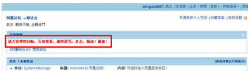
(图17、在凤凰论坛发布“九评共产党”的出现警告的系统提示。)