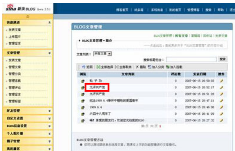
(图20、在新浪博客发表“九评共产党”后，文章在后台还存在。)