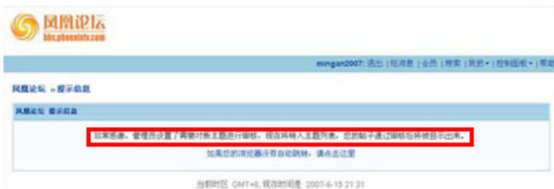
(图6、在凤凰论坛发布“讨伐中宣部”的帖子后显示“非常感谢，管理员设置了需要对新主题进行审核，现在将转入主题列表，您的帖子通过审核后将被显示出来。”)

在凤凰论坛发布“讨伐中宣部”的帖子时，出现的却是“非常感谢，管理员设置了需要对新主题进行审核，现在将转入主题列表，您的帖子通过审核后将被显示出来。”（见图6）