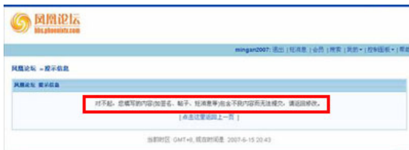
（图13、在凤凰论坛发布“六四十八周年了”的帖子后显示无法提交，需要修改。）

帖子发表后，视窗里出现：“对不起，您填写的内容（如签名、帖子、短消息等）包含不良内容而无法提交，请返回修改。”（见图13）