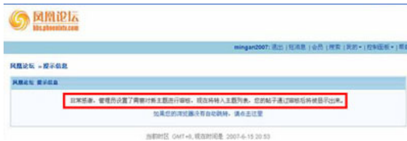
（图16、在凤凰论坛发布“九评共产党”的出现需要审核的系统提示。）

在凤凰论坛发布“九评共产党”的帖子，出现的是“非常感谢，管理员设置了需要对新主题进行审核，现在将转入主题列表，您的帖子通过审核后将被显示出来。”（见图16）