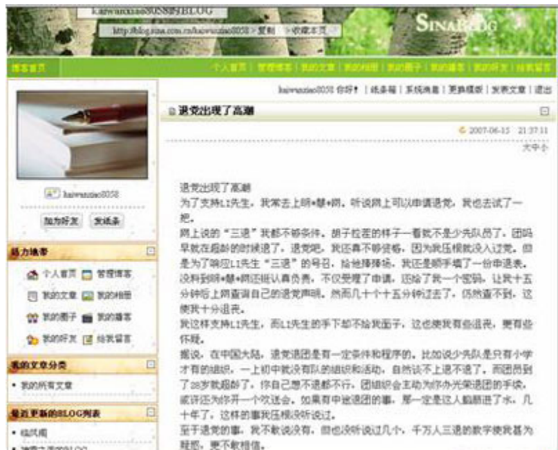
(图11、在新浪博客发表“退党出现了高潮”的文章，起初能正常显示。)

4分30秒后被删除，收到管理员发来的系统消息：“抱歉，您发表的文章《退党出现了高潮》已被系统管理员删除，给你带来的不便，我们深表歉意。如有疑问请给我们发邮件，我们收到邮件24小时内给您回复。”（见图12）