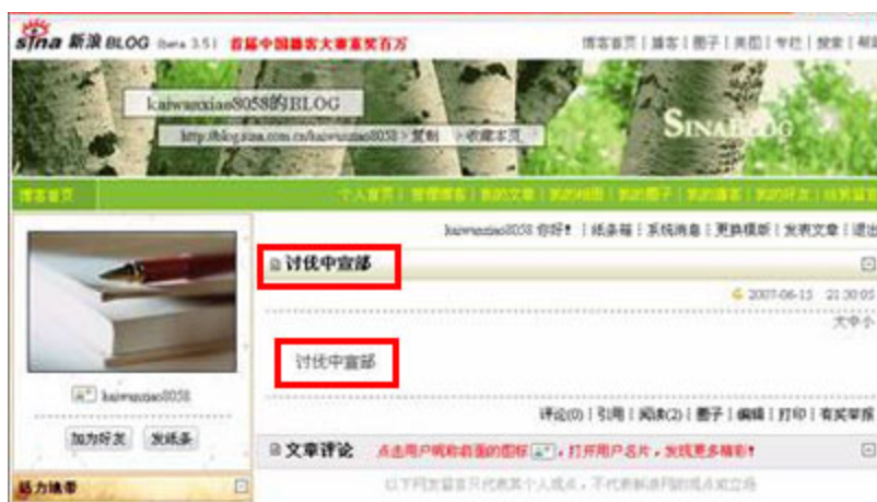
(图8、在新浪博客发布“讨伐中宣部”的博客文章能正常显示。)