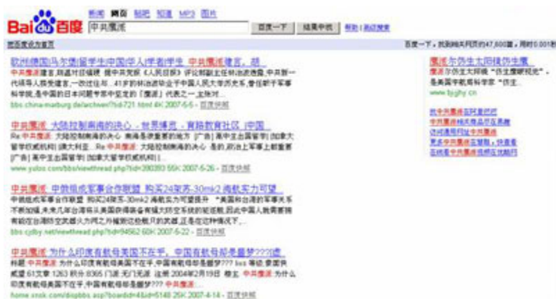
(图5、在百度正常搜索“中共鹰派”，结果显示47,600篇，用时0.001秒。)