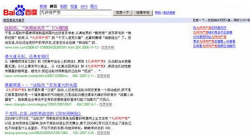
(图18、在百度搜索“九评共产党”后仅仅出现4篇相关网页。)