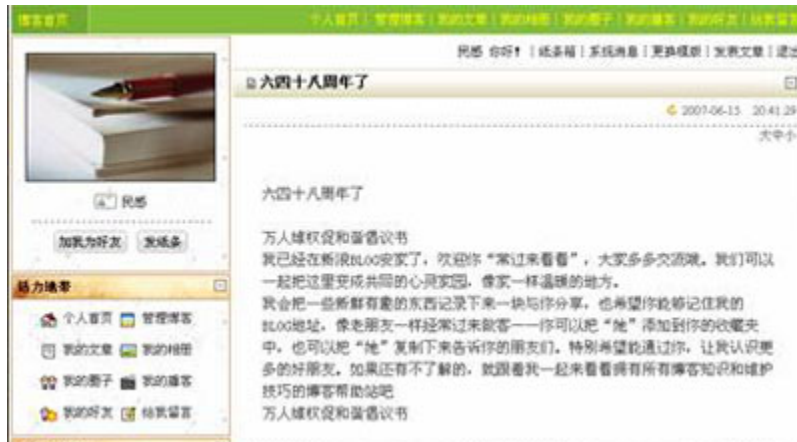
（图15、在新浪博客发表“六四十八周年了”能正常显示。）