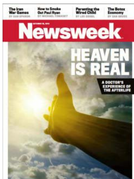
图《天堂的证据》被用作封面文章刊登在美国《新闻周刊》杂志中。

亚历山大听到了充满欢乐的一曲圣歌。他感到，在那样一个世界，视觉和听觉并非如现实世界这样