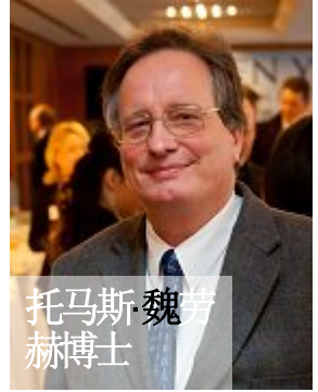
托马斯魏劳赫博士

“（共产党）对法轮功的迫害没有法律可循，违反了国际法，也违反了中国的宪法以及刑法，还有刑事诉讼法。”魏劳赫博士：“这些被迫害的人只是做了他们认为好的事。他们不想干坏事，他们通过他们的行动和思想使这个世界变得更好。这怎么能违反了法律呢？在中国刑法中也没有这样规定。六一零办公室在一九九九年六月成立，只是为了迫害一群不伤害别人、用自己的信念去生活的民众，中国（中共）政府到现在也没有为此感到抱歉。”