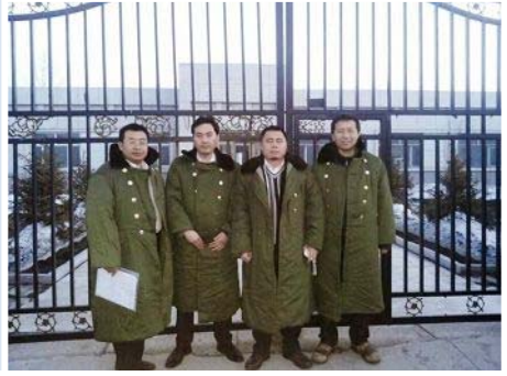
律师和家属在黑监狱门前喊话