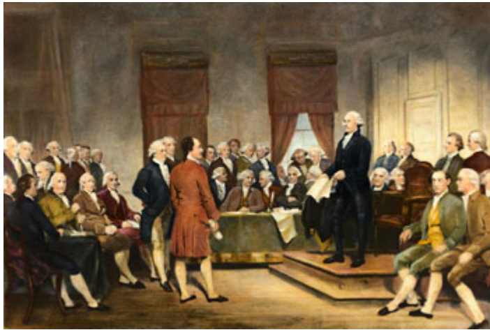
1787 年於費城頒佈的美國憲法