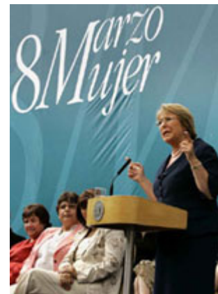
民主制度的自信愈強，候選人就會愈為多樣化。Michelle Bachelet經過選舉成為智利總統之後，拓展了女性的政治版圖。

民主制度仰賴公開與可信而存在，但卻有一個重要的例外：就是投票這件事本身。要將受脅迫的機會降到最低，民主制度下的選民必須被允許以秘密投票的方式行使投票權。同時保護票匱、計算票數的工作，應盡量公開其執行流程，如此一來人民才能信賴投票結果是正確的，政府確實是依賴人民的「同意」而存在的。