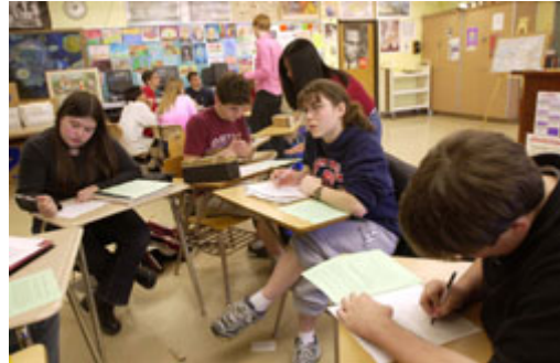
在美國聯邦制度下，警政與教育等制度多數由地方層級政府自理財源與管理。

自由的人民可選擇其中一種多數人同意的憲政架構，執行方式有很多種。有些民主制度中有單一的政府。另一種方式則為聯邦體系的政府 — 政府權利由地方、地區和國家政府共享。