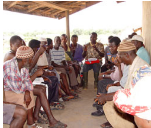
民主制度必然會有衝突與一致的不同狀況，在此圖中，獅子山國內一群男性正在討論法律議題。

需求的發言空間，社會將會自內部產生崩解；如果政府施加過多壓力企圖達成共識，忽視人們的聲音，社會則會從上而下被摧毀。