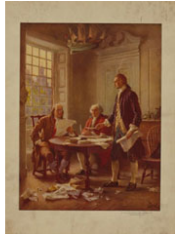
在圖中班傑明富蘭克林、約翰亞當斯、湯瑪斯傑佛遜起草了獨立宣言，該宣言的宣告成為美國民主的基礎。

更具體地說、在民主社會中，這些基本或他人不得侵犯的權利，包括了言論和表達意見的自由、信仰宗教的自由、集會自由、以及在法律之前受到平等保護的權利。這並不是民主社會中公民所能享有的所有權利，但卻是任何民主政府之所以有資格稱為民主，所不可或缺的核心權利。由於他們是獨立於政府之外，從傑佛遜的觀點來看，這些權利便不得以立法方式剝奪，也不容以選舉多數的藉口加以侵害。