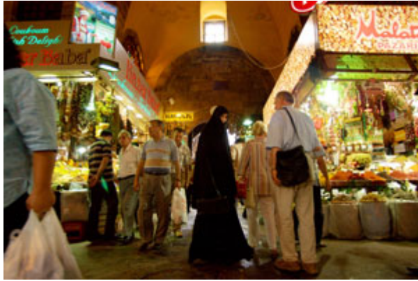
民主發展與經濟繁榮通常是相輔相成的：上圖為伊斯坦堡的一處市場。

人民的言論和集會自由不受傷害。人民可以強力而公開的反對政府官員的行為，但若鼓吹行刺該官員，則是犯罪。