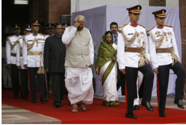
部分民主社會結合了總統制與內閣制的元素。上圖為 2007 年印度總統帕蒂爾（Pratibha Patil）抵達就職典禮的狀況。

如前所述，透過自由的選舉，民主制度下的公民將法律定義的權利授與國家領導人。在憲政民主制度內，政府權利區分為立法單位制訂法律，行政單位加以執行，司法單位則以半獨立的模式運作。這些部門有時被形容為「權力分立」(separation of powers)，