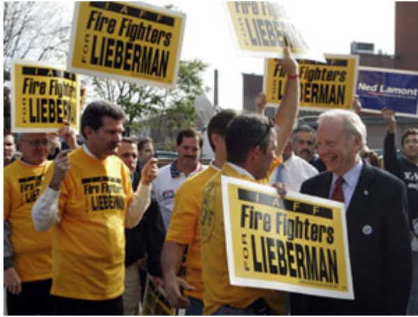
康乃迪克州參議員候選人Joseph Lieberman於 2006 年與救火隊員團體的會面。政治人物會分別接觸各個利益團體，爭取團體的支持。

許多傳統的利益團體都圍繞著經濟議題打轉；商業與農業團體、勞工聯盟等組織，在多數民主體系中仍扮演強有力的角色。在近數十年來，利益團體的性質有所變化，數量大幅成長，其關注領域擴及包含社會、文化、政治、各種宗教、活動等幾乎所有領域。專業性組織興起，與利益團體為共同的目標合作 — 從為窮人改善健保制度，到保護環境 — 這些