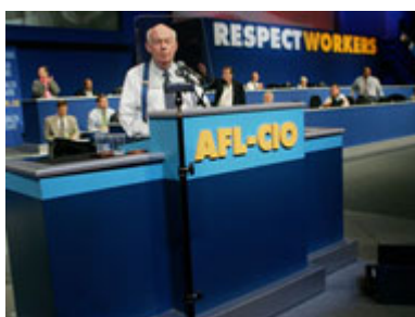
John Sweeney 是美國聯邦政府勞工組織 (U.S. Federation in labor organizations, AFL-CIO) 主席，圖中是他發表演講的情況。工會仍然

利益團體的動力來源相當複雜，人數是一個重點 — 在全國有廣大成員的團體就能自然吸引注意力、受到政府官員的重視，但很多情況下，規模小但組織牢固、堅持所重視議題看法的團體，也能破除人數的限制、創造很大影響力。