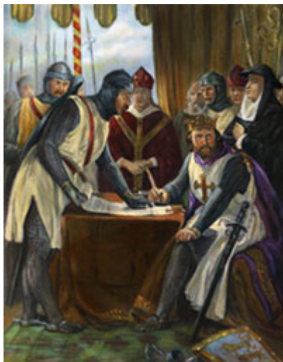
在 1215 年，英國貴族向英王約翰施壓，要求簽署大憲章（ Magna Carta ），這是英國邁向憲政民主的關鍵一步，藉由此舉英王開始瞭解自己和所有人一樣需受法律約束，並賦予人民法定權利。

自由與民主常被交替著使用，但其實兩者並非同義詞。民主是自由的完整概念與原則，但也包含歷經長時間曲折歷史之後，形塑而出的常規與流程。民主就是制度化的自由。