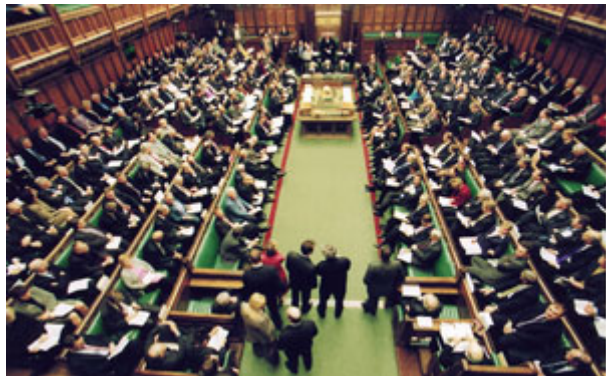
英國國會中的下議院，是全球歷史最悠久、也最成功的民主制度體現地點。

在民主國家中，限制行政權的方法有三：一是上述的權力分立，立法、司法機關可以制衡行政機關；二是基本人權由憲法保障，不容行政機關濫權；三是定期舉行選舉。