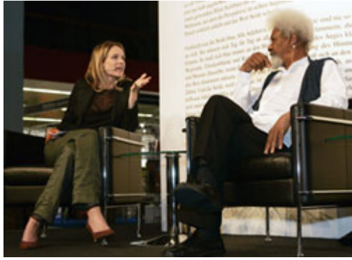
針對任何主題進行公開討論 — 無論是個人的、文化的、政治的議題皆可 — 這就是民主不可或缺的命脈。上圖：奈及利亞的諾貝爾獎得獎者 Wole Soyinka 於瑞士書展中公開言論的圖片。