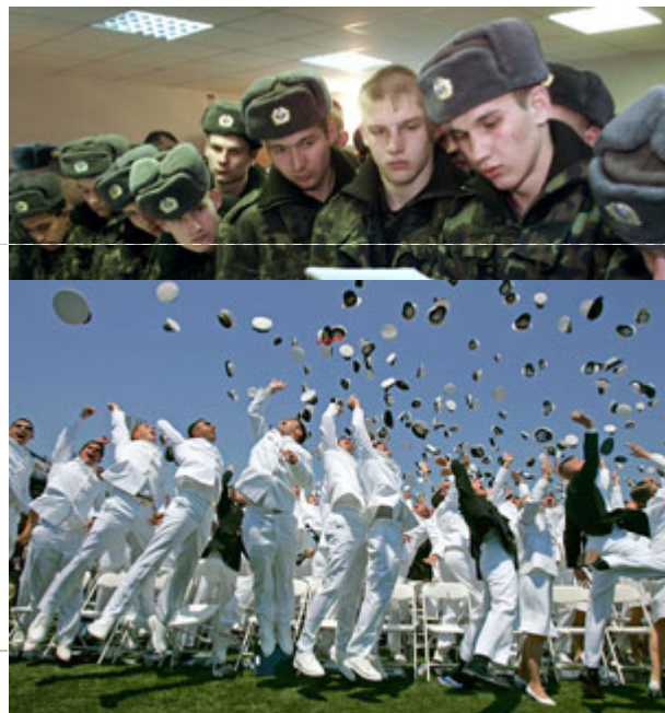
美國軍校學生在畢業前將軍帽向空中拋去的畫面。專業的軍人也需要和文人領導者擁有同等教育水準。

民主政體中，防禦與威脅國家安全的議題，必須由人民所選出的代表來決定。民主制度中的軍隊肩負為國家服務的天職，而不是