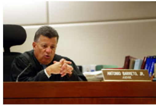
法官的專業是抵抗社會與政治壓力的最佳防禦工具。

國會議員可針對政府官員的行為與決策提出質疑，核准國家預算，確認法院與部會高級官員的任命。部分民主國家的國會設有委員會，提供立法者一個公開檢視