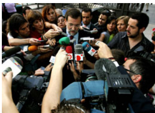
「忠誠反對黨」會對政府提出批評與檢視，圖中為西班牙反對黨對媒體發言的畫面。

當今多數民主政體採行的內閣制，訴求該制度的快速回應與高度彈性。內閣制政府，特別是透過比例代表制選出的內閣制政府，多朝向多黨化發展，即使相對勢力較小的政治團體，亦能於立法機關中有代表席次。因此，少數族群仍能參與最高層級的政治決策過程。而包含聯合政府的瓦解，最強政黨失去人民對它的授權，首相辭職與新政府組成或舉行選舉