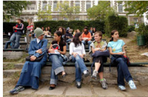
教育能讓心靈自世俗中解放，如同圖中這些土耳其大學學生一樣。

在教育與民主價值之間有直接的連接關係：在民主社會中，教育的內容與執行，能對人民養成民主治理的習慣有所幫助。這種教育的傳承過程是民主制度的重要關鍵，因為有效的民主是動態彈性的、政府的型態取決於公民的獨立意志要求。正面的社會與政治改變機會都掌握在人民的手中。政府不應將教育系統視為灌輸思想給學生的工具，而應提供教育系統更多資源，幫助他們滿足其他人民的基本需求。