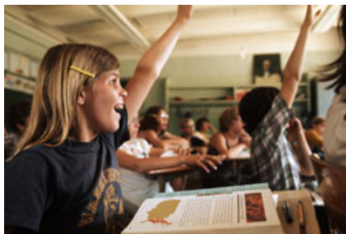
受過教育的公民，才可能成為一個真正自由的公民。