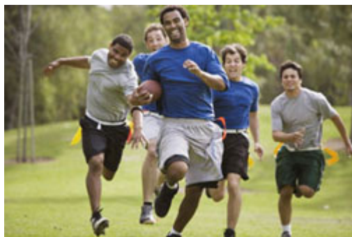
個人為自己的目標投入全部心力，強化個人自我認同。