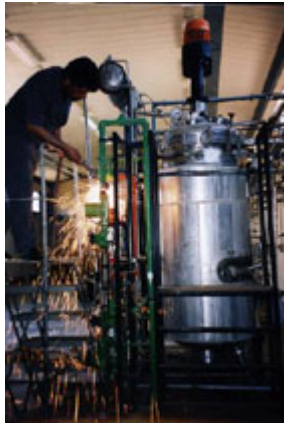
聯合國工作人員 1996 年在 伊拉克拆除可用於生產生物 武器的一個發酵罐以便銷 毀。

大量證據表明，巴格達正在竭力保持並擴大其生物武器項目。據中央情報局報告，道拉(Al-Dawrah)口蹄疫疫苗生產設施擁有一種複雜的空氣過濾系統。在海灣戰爭前，該設施曾被用於生產生物制劑。聯合國特委會銷毀了該廠與生物武器相關的設備，但留下了其它設備。2001 年，未經聯合國批准，伊拉克宣佈將改造這家工廠，用於生產防治口蹄疫的疫苗，儘管伊拉克可以更簡便、更迅速地進口所需的全部疫苗。