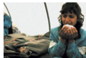
一名少女驚駭地目睹 1988

要知道，這是極其陰險惡毒的。伊拉克人知道毒氣比空氣重，因此在對這 個地區進行幾個小時的傳統炮火攻擊後釋放毒氣，毒氣向地窖和地下室滲透造成的效果會更大。這也就是說，他們知道人們在遭到密集的炮火攻擊時總會逃到地下室去。當他們被困在地下室時，（伊拉克人）用化學武器發起攻擊.....使地下室實際上變成了毒氣室。