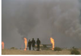
1991 年，三名科威特難民 迎著地平在線的熊熊油井大火， 從伊拉克邊界向家園走去。

薩達姆不僅掠奪了一個國家，而且還對環境進行了肆意的大規模破壞。伊拉克軍隊 1991 年 2 月在海灣戰爭後期，放火燒了 1100 多口科威特油井，造成也許是歷史上最大規模的對經濟和環境的一次性蓄意破壞。這些並不是軍人的瘋狂或無軍紀之舉，而是煞費苦心的行動：在井口四周安放炸藥，將炸藥與中央引爆裝置連接，然後堆上沙包從而讓爆炸力作用到井內，增加破壞效果。