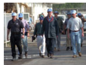
聯合國特委會導彈小群組 1997 年在巴格達被拒絕進 入核查地點。

聯合國特委會還發現了一份檔案，檔案顯示伊拉克軍事工業委員會計劃發展移動發酵裝置，這種裝置可被用作移動生物武器試驗室。最近倒戈的一位人士在接受《名利場》雜誌採訪時說，他曾裝配了一個車隊的雷諾卡車，車輛擁有可用於生物武器的裝備。這些卡車從外表上看同運送食品的普通冷藏車沒有區別。"這些車看上去象運送肉類和酸奶的卡車，" 他這樣解釋道。"而裡面是一個實驗室，配備有培養細菌的恆溫器、顯微鏡和冷氣機設備。"