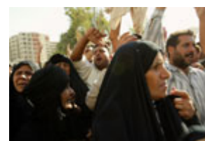
在大赦令頒布後下落不明的 伊拉克囚犯的親人 10 月 22 日在巴格達示威。

根據這份報告，也是在 2001 年，伊拉克政權以從事反政府活動的罪名處決了 37 名在押政治人士。據新聞媒體報導，"著名的庫爾德族作家穆罕默德·賈米勒·班迪·羅茲巴亞尼(MuhammadJamil Bandi Rozhbayani)因撰寫針對政府的阿拉伯化和種民清洗計劃的文章受到情報人員的調查，在情報人員到過他家以後，他於 3 月份遭到殺害。"