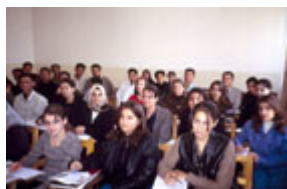
蘇萊曼尼亞大學的英文課 (Michael Rubin)

由於我們已經有一段時間的相對和平環境 — 毫無疑問由於有美英兩國軍隊在土爾其的配合下向我們提供了保護 — 我們已經能夠開始推行自治了。一個有形的公民社會和法治制度開始從大屠殺的灰燼中站立起來了。我不會對你說，樣樣事情都十全十美。我們有我們的問題。民主體制的成長，要經過很長時間。但是，只消看看這種可怕的地緣政治和我們以往的歷史，我們已經取得的成就是很可觀的。 .