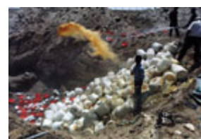
聯合國工作人員 1996 年在 伊拉克銷毀可用於生物武器 生產的生長介質。

所必需的細菌生長培養基等被銷毀。然而，伊拉克再次對其發展和儲存生物制劑的情況採取了欺騙隱瞞的慣用手法。聯合國特委會專家斷定，伊拉克實際生產的炭疽桿菌(引發炭疽病的病菌)和使呼吸道肌肉癱瘓的肉毒黴素是聯合國特委會銷毀數量的二至四倍。