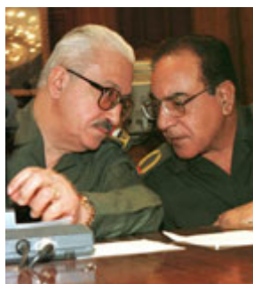
伊拉克副總理塔裡克．阿齊茲(左)與外長穆罕默德．賽義德．薩哈夫 1998 年在向伊拉克國民議會通報伊領導層有關中斷與聯合國核查人員合作的決定之前交談。