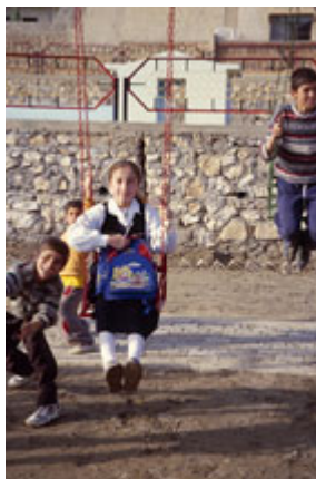
伊拉克北部杜胡克一個普通住宅區的兒童在新的遊戲場