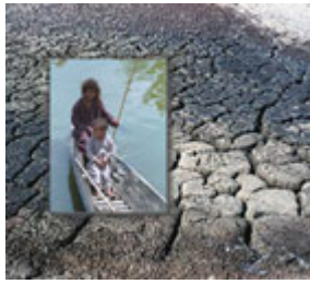
兩名伊拉克兒童(內套照片)1994 年在阿布舒維什沼澤地划獨木舟；背景照片是今日乾裂的沼澤地。

1993 年，沼澤地帶聚居著 20 萬至 25 萬居民，其中一半以上為沼澤地阿拉伯人，其它則為境內各種流離失所人員和反對派人士。今天，幾乎所有人都無家可歸，不到 1 萬名沼澤地阿拉伯人仍在薩達姆政權有步驟的破壞、推毀和炮擊中度日。成千上萬的其它人，包括婦女和兒童，遭到伊拉克軍隊秘密殺害，伊拉克的又一支獨特文化被薩達姆．侯賽因摧毀。