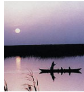
美索不達米亞南部沼澤地。

根據歷史、邏輯和事實，我們只能得出一個結論：薩達姆．侯賽因政權是一個與日俱增的嚴重危險；任何其它設想都是不顧事實的一廂情願。如果認為這個政權會有誠意，就等於拿著億萬人的生命與世界和平進行一場輕率賭博。我們絕不能冒這個風險。