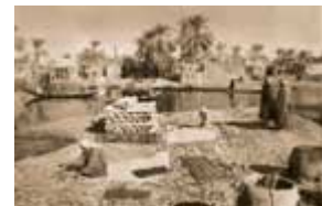
伊拉克沼澤地區的生活在 1980 年以前生機勃勃。

數千年來，這片大約 5200 平方公里的沼澤地是成千上萬沼澤地阿拉伯居民的一切基本生活資源。在兩伊戰爭期間，伊拉克軍方建造堤道，以方便沿南部邊界運送裝甲部隊和給養物資。堤道導致沼澤地東部三分之一地區在 20 世紀 80 年代中期至晚期逐漸枯竭。在 1991 年什葉派人的起義之後，巴格達政權開始了抽乾整個地區的浩大工程。隨著一個東西走向的水壩和一條南北走向的運河的竣工，通往阿馬拉沼澤地的主要水源被切斷。