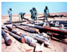
聯合國工作人員 90 年代在 密封據說裝有沙林神經毒氣 的 122 毫米伊拉克火箭。