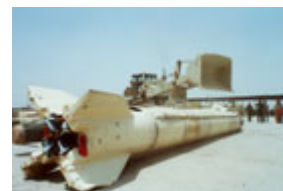
一枚 90 年代待被聯合國武器核查人員銷毀的伊拉克侯賽因飛毛腿導彈。

海灣戰爭以後，國際原子能機構成功地拆除了伊拉克 40 個核研究和開發設施，包括 3 處可用於生產武器的核生產設施。1991 年前，這些設施全不為外界所知。這些核查工作最後以 1998 年國際原子能機構和聯合國特委會的核查人員全部被撤離伊拉克而告終。其結果是，四年來，一直沒有可能對巴格達的核項目進行現場確認。但是，人們根據倒戈者提供的證據、購買兩用設備的情況和在黑市採購非法核相關原料的有據可查的事實只能得出一個結論：伊拉克重新全力以赴，在世界範圍內購買、竊取或發展核武器。