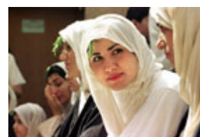
伊拉克曼達派薩比教的女信徒 2000 年 6 月在巴格達接受寺院池水的聖洗後坐在陽光下小憩。

薩達姆．侯賽因是對本國人民施虐的暴徒，是對外圍各國的威脅，是危害國際和平與穩定的禍根。剷除他，不僅為那個地區和全世界去除了一個嚴重的、與日俱增的危險，而且還將使伊拉克人民再次能夠自由地、無所恐懼地締造自己的未來。