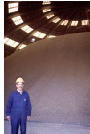
伊拉克北部塔斯魯傑(Tasluja)的一座水泥廠。