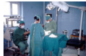
哈萊卜傑的手術室，其設備由石油換糧食計劃所得資金購置。(Michael Rubin)

民主原則與實踐小群組 2002 年 9 月至 10 月在倫敦郊外開會。派代表參加會議的黨派和團體的數目之多及其多樣化，顯示出這些黨派團體致力於民主和多元。它們當中有：伊拉克國民大會(Iraqi National Congress)、伊拉克民族陣線(Iraqi National Front)、伊拉克民族協約(Iraqi National Accord)、庫爾德斯坦愛國聯盟(Patriotic Union of Kurdistan)、庫爾德斯坦民主黨(Kurdistan Democratic Party)、君主立憲運動(Constitutional Monarchy Movement)、伊拉克土庫曼陣線(Iraqi Turkoman Front)、伊拉克國民運動(Iraqi National Movement)、伊拉克部族聯盟(Alliance of Iraqi Tribes)、伊拉克民主論壇(Iraqi Forum for Democracy)、伊拉克民族聯盟(Iraqi National Coalition)，還有亞述族的代表。