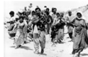
在 1991 年反薩達姆·侯賽因的起義失敗後，這家庫爾德人被伊拉克軍隊趕出家園，遷往難民營。

根據聯合國後來決議的要求，一些被洗劫的物品 — 特別是博物館收藏品 — 被歸還給科威特，國際社會迫使伊拉克用其石油所得的部份收入支付戰爭賠償。但是許多珍藏品、博物館檔案和其它被盜物品 — 最痛心的是科威特的公民 — 至今仍下落不明。