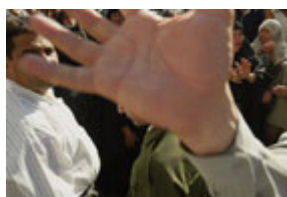
伊拉克官員向一名攝影師示意不要拍攝示威者。示威者的在押親人在薩達姆。侯賽因 10 月 21 日頒布大赦令後下落不明。

根據大赦國際的報告，伊拉克是世界上不明失蹤人數最多的國家。但是，當局完全拒絕國際群組織和鄰國提出的探尋數以千計人的命運的要求和請求。大多數"失蹤人士"是伊拉克北部的庫爾德族人，伊拉克南部什葉派社區的失蹤人數居第二位。其它少數民族，如亞述人、土庫曼人和亞齊德人，也都有長期失蹤的人。