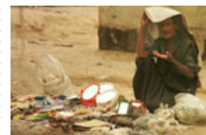
在 1999 年發生反政府暴動的城市巴士拉，一名男子在擺地攤。

用曾經擔任聯合國伊拉克問題報告專員的馬克斯·范德·斯圖爾(Max van der Stoel)的話說，巴格達政權是"自二次世界大戰以來世界所目睹的最殘酷的獨裁專制政權。"