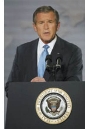
布什總統 2002 年 10 月 7 日指出伊拉克與恐怖主義分子相勾結。

我們知道，伊拉克和"基地"群組織之間十年前就有高層聯繫.....伊拉克在任何一天都可能決定向某個恐怖主義群組織或恐怖主義分子提供生物或化學武器。同恐怖主義分子勾結在一起可使伊拉克政權向美國發動攻擊而又不至於留下任何蛛絲馬跡。