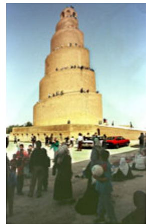
薩邁拉鎮 (Samarra) 大星

美國同國際社會一道合作，從長遠角度謀求在伊拉克建立一個具有廣泛基礎和代表性的民主政府。這樣一個未來的伊拉克，將是一個團結的 — 而且是統一的 — 國家，它的政府將摒棄恐怖行徑和大規模毀滅性武器、尊重國際法律和準則、讓所有宗教和民族都有發言權、恪守法治、成為整個地區和平與寬容的典範。