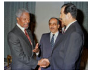
薩達姆．侯賽因與聯合國秘書長科菲．安南(左)1998年在巴格達會面，安南在努力化解聯合國與伊拉克之間的對峙局面。(美聯社照片/伊拉克通訊社；新聞公用片)

最後，在 1998 年 10 月，伊拉克政權停止其與聯合國特委會的任何表面形式的合作，迫使檢查小群組離開伊拉克。作為對伊拉克的懲罰，美國和英國於 1998 年 12 月發起了代號為"沙漠之狐"的空襲行動，打擊可疑的化學和生物武器設施。