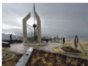
> 伊拉克庫爾德男子走在哈萊卜傑市的群葬地紀念碑附近。

伊拉克政權長期以來一直大力進行恐怖主義訓練和群組織活動，其基地大都在塞勒曼帕克(Salman Pak)地區附近。此外，有有力證據顯示，從阿富汗逃出來的"基地"群組織的恐怖主義分子在伊拉克國內得到庇護。