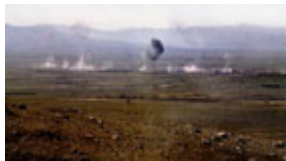
1988 年從遠處看到伊拉克軍隊對哈萊卜傑投放化學炸彈。(美國政府照片)

這些武器除了有很多可怕的直接後果外，如：造成當場死亡或皮膚和眼睛灼痛，伊拉克政府的檔案還顯示，它們是被蓄意用來達到已知的長期效果，包括癌症、先天缺陷、神經問題和不孕。鑒於這種武器以單位殺傷人數計算成本低廉，有證據證明，復興黨軍隊使用不同毒氣的混合物，來試驗這些武器作為恐怖和戰爭武器的威力。