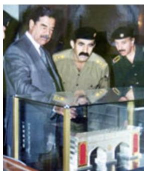
薩達姆．侯賽因查看阿拉伯復興社會黨 2002 年贈送的生日禮物 — 巴士拉門模型。

薩達姆．侯賽因對伊拉克的宗教社區的攻擊和利用，同他對其他任何試圖稍微獨立於薩達姆政權的個人、團體或群組織的攻擊與利用一樣殘酷無情。