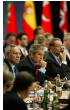
喬治．布什總統(中)、科林．鮑威爾國務卿(左)和歐

薩達姆政權的統治所到之處，言論自由、宗教自由、政治集會自由、隱私權、法律規定的合法程序，都根本不存在。