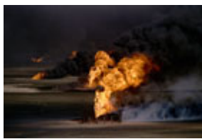
1991 年，被潰逃的伊拉克 軍隊點燃的科威特油井，烈 焰滾滾、濃煙毒氣沖天。

薩達姆並沒有就此罷手，他還蓄意開放油管，將 400 萬至 1100 萬桶石油洩入波斯灣，造成有史以來最大規模的一次性海中洩油事件，導致出現長 40 公里、寬 12 公里的浮油面。石油污染了科威特和沙特阿拉伯 1300 多公里的海岸線，造成 1.5 萬至 3 萬隻海鳥死亡。這些油還摧毀了其它海生物，尤其是海龜。人們至今仍在觀察海灣地區生態所受到的長期損害情況。