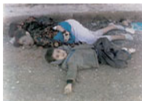
哈萊卜傑化學武器攻擊的受害兒童。

在去阿納伯的路上，很多婦女和兒童紛紛死亡。地面上有一層很濃的化學 煙霧，我們可以看得見。"他說，到處都有人死去。當一個孩子支持不下去的時候，他的父母驚恐 萬狀，把他扔下。"很多孩子被棄於路旁。還有很多老人。他們先是跑，然後就停止了呼吸，死去。