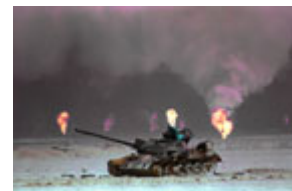
在油井火海旁的一輛被擊毀 的伊拉克坦克

在國際社會花了幾個月的巨大努力將油井大火撲滅後，據專家估計，燃燒的油井向大氣層釋放出 5000 多噸油煙、100 至 200 萬噸二氧化碳、9000 噸二氧化硫、以及未定量的有毒化學物質。土耳其境內出現了黑雨，喜馬拉雅山麓降下黑雪。