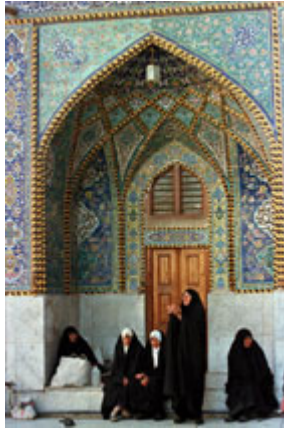
什葉派婦女在卡爾巴拉的阿 撥斯清真寺祈禱，伊拉克軍 方 1991 年在這裡鎮壓了反 薩達姆·侯賽因的起義。

海灣戰爭失敗後，薩達姆的軍隊在庫爾德人居住的北方以及以什葉派教徒佔多數的南方，以監禁、導致失蹤和集體處決等極端殘酷手段鎮壓了當地的起義。伊拉克在北方和南方進行的報復造成民宅和包括清真寺在內的建築被毀，乃至使整個村莊夷為平地。