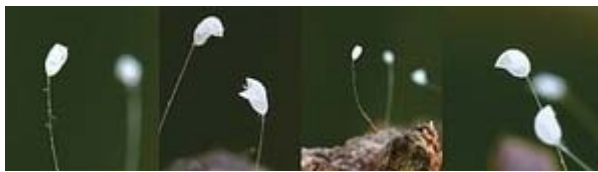
2011 年在美國馬裏蘭州盛開的優曇婆羅花

在東方同樣也記載了未來佛彌勒（轉輪聖王）下世的另一重大信號。佛經《慧琳音義》卷八載明：“優曇婆羅花為祥瑞靈異之所感，乃天花，為世間所無，若如來下生、金輪王出現世間，以大福德力故，感得此花出現。”