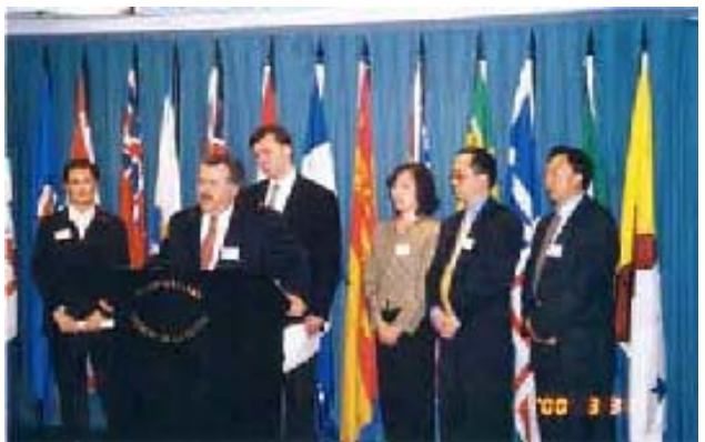
加拿大国会议员和法轮功学员于渥太华国会山举行记者会

2006年9月29日，美国国会首次就中共活体摘取法轮功学员器官指控举办听证会，四名证人在听证会上作证。