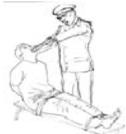
酷刑之一：电棍电击学员口腔

根据江的构想，“中央委员会和政府各部委单位，以及中央政府直接领导下的各省、自治区和直辖市需要密切配合‘610办公室’”，中国各省、市、自治区、直辖市都相应设立“610办公室”，直接指挥控制各级党政机关及公安、检察、法院、劳改、劳教部门、国安部门及宣传机构、新闻媒体。这样，从中央到地方自上而下的形成了一个严密、独立运作的体系，是江泽民系统迫害法轮功及无辜百姓的总指挥部。