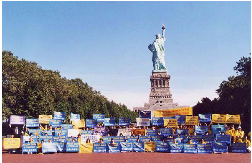
2000年9月，各国法轮功学员代表在美国纽约自由女神岛声援大陆同修

2006年3月10日起，美国首都华盛顿DC、休士顿、旧金山湾区、纽约、香港、渥太华、伦敦、韩国、多伦多、温哥华、洛杉矶、加拿大蒙特利尔、泰国、日本、维也纳、美国德克萨斯州、芝加哥、台湾高雄、加拿大埃德蒙顿、加拿大卡尔加里、澳洲昆