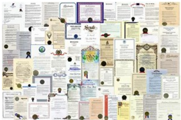
法轮功在全世界载誉无数

1999 年 6 月 25 日，法轮功创始人首次到美国芝加哥演讲，芝加哥市长将这一天定为