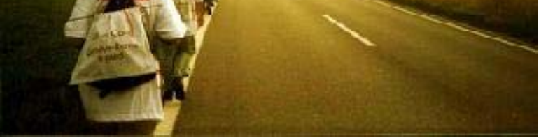
从日内瓦至伯尔尼步行

参加这次紧急营救汽车之旅美中线圣路易小组的有 5 名法轮功学员，是年龄从 60 岁到 73 岁的老阿姨。15 日上午 9 点 30 分，圣路易市法轮功学员在当地著名的森林公园举行了新闻发布会，宣读了这次汽车之旅的目的。5 位学员还各自介绍了自己为什么要参加紧急营救汽车之旅。