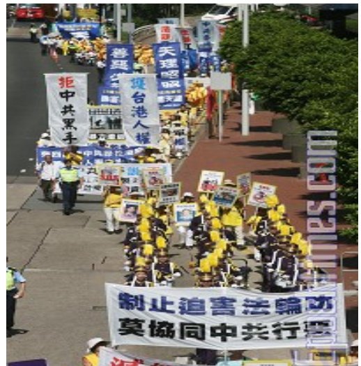
华盛顿集会声援 2400 万“三退”勇士

他呼吁还未退出中共的中国人要做承天意、得民心之事，参与到推动和平结束中共暴政的退党大潮之中。