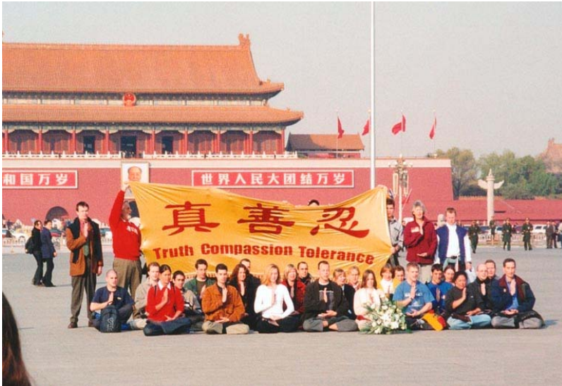
36名西人法轮功学员天安门广场和平请愿

这些为证实大法和救度众生而将个人生死置之度外的大法弟子，心中念着师父常用的正法口诀，在