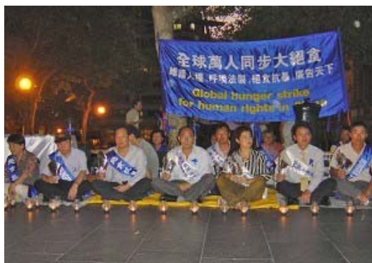
悉尼近400人参加声援万人绝食维权活动

关于维权绝食运动的意义，高智晟律师日前在《什么是我们的胜利》一文中指出，大量的中国人勇敢的走了出来，揭露野蛮暴政、唤起民众对专制独裁本身的认识，这个过程的本身“即是我们的胜利”。