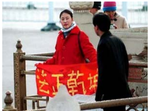
天安门广场红梅开

2001年1月1日，至少有700名大陆法轮功学员天安门请愿被捕。警察一度平均两分钟逮捕一名请愿学员。