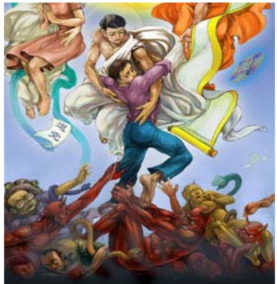
天要灭中共，退党保平安

【九评之九】 评中国共产党的流氓本性：前言；一、共产党的流氓本质从来没有改变；二、经济发展成为中共的祭品；三、中共的洗脑术从“赤裸裸”走向“精致化”；四、中共的人权伪装；五、中共流氓嘴脸面面观；六、流氓嘴脸大暴露；七、以国家恐怖主义铲除“真善忍”；八、“中国特色”的流氓社会主义；结语。