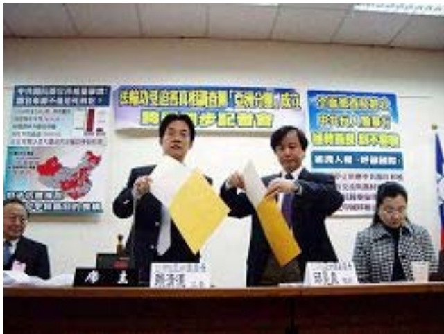
亚洲分团团长、副团长装寄写给中共官员的信件

“我们是‘法轮功受迫害真相联合调查团’全球四大分团的代表，受 300 多名集各国政要、宗教领袖、律师、医生和人权活动家的委托，致函给你们，郑重要求：立即停止对法轮功群体和其支持者的迫害，并就‘活摘器官’的指控，接受国际社会的核实查证。