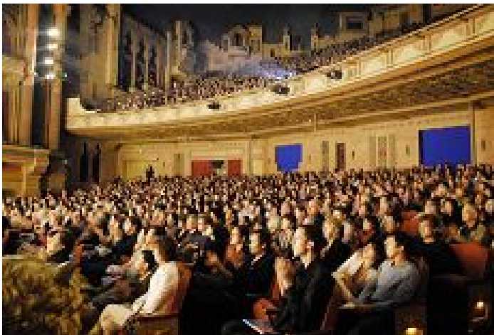
震撼心灵的演出吸引各族民众观看

加拿大著名演员、杰美尼大奖获得者，影片《沙尘暴》的编剧和导演密切尔·玛和嫩表示，这台晚会不同于他此前看过的任何舞台表演。他能够感受到舞台上的演员和现场乐队纯净的无一丝杂念，拥有无比的和谐；他们共同用诚恳之心为现场观众献上了一台心灵和艺术的盛筵。他说：“晚会上的表演最为突出的是其背后的内涵。晚会的主题是神话与传奇，而实际上表演所展示的主题比这还要深邃。在世界各地流传了众多的经典，他们之所以成为经典是因为他们描述了一个人为了他人，为了国家或者为了其他什么而牺牲自己。但这里所展示的内涵却更为深远。演出的第一个节目便将人带到那无限高远的世界，展现了那里的众神为了更洪大的目标所立下的甘愿牺牲的誓约，节目所展现的超越了地域和历史的