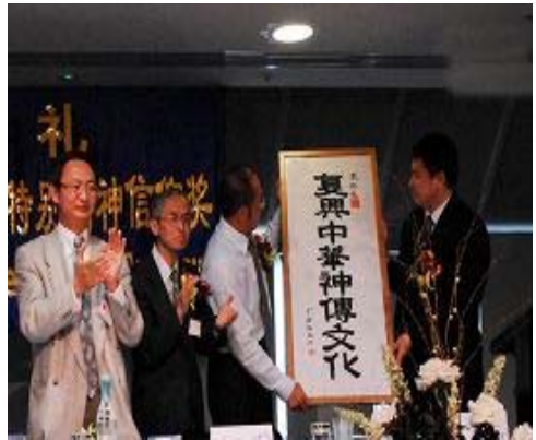
张而平转赠李洪志先生的亲笔题词

颁奖大会由自由文化运动协调委员会委员仲维光主持。袁红冰代表中国自由文化运动评委会致颁奖辞，他说：“从上个世纪末至今天，在中国的大地上持续发生着一场当代世界上最严重的人权灾难，就是中共暴政对法轮功精神修炼者的政治大迫害。这场政治大迫害已经深刻的伤害了人类的良知。”“中共暴政动用它所垄断的全部国家暴力机器，把国家恐怖主义发挥到极致，企图摧毁法轮功精神修炼者的信仰。但是，迄今为止的历史进程告诉人们，中共暴政失败了，而且正在走向最后的失败。”“面对比法西斯更凶残的中共暴政，法轮功精神修炼者以坚忍不拔的意志维护自己信仰权利的行为，证明了一个真理：强权没有能力战胜精神信仰。面对惨绝人寰的政治大迫害，法轮功精神修炼者以和平而又英勇顽强的方式对暴政的抗争，正在赢得历史的尊敬。”