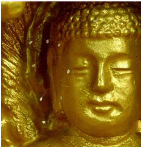
2005 年韩国须弥山禅院首开优昙婆罗花

仅隔一年，被封存一千多年的佛指骨舍利于陕西省扶凤县的法门寺在人们不经意间突然再现，引起了佛教界的兴奋与震动，意识到神在发出某种警示。那么神要告诉人们什么？第一，神告诉世人，一年前在韩国面世的《格庵遗录》是对释迦牟尼佛当年所言关于末法时期“转轮圣王”下世传法救人之天机的解释和补充；第二，神以佛指舍利再现的日子——（古历）四月初八，强调这就是《格庵遗录》中所言大圣人四月出生的准确日期（正是李洪志先生的生日）；第三，神提醒人们关注释迦牟尼佛当年的另一预言：当 3000 年开花一次的优昙婆罗花开放时，意味着“转轮圣王”正在人间正法。