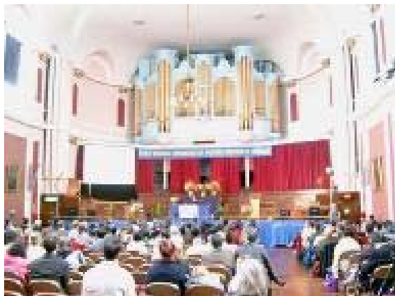
首届世界未来科学与文化大会在剑桥大学隆重召开

例如，有一篇《画与道——通过修炼上达化境》谈到：“我们通常藉山水作为宇宙之道的象征，人法地，地法天，天法道，道法自然。所以中国的艺术较少表达人的东西，而是表达自然，因为自然就是道的象征。现代艺术很狭隘的表现个人、自我的局限性和封闭性，事实上离道甚远。”几句话就把重点讲清楚了。