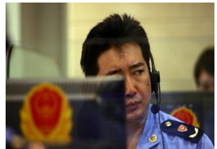
中国全民被立体监控

因此，把奥运会问题政治化的正是中共自己。中共已把奥运当成巩固政权、打压正义良知的借口和最佳时机。