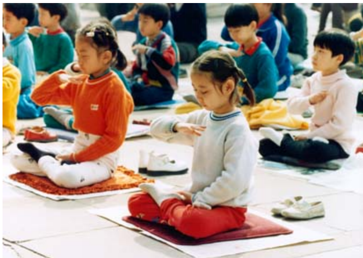
法轮功适合任何年龄段的人士修炼

尽快静下心来通读一遍《转法轮》，或者按顺序静心观看一遍李洪志老师的讲法录像（听一遍讲法录音也能收到同样的效果）。《转法轮》包含《论语》和九讲内容，讲法录像、录音也是九讲。世界各地（特别是大城市）通常都有法轮功学员义务服务的炼功点。你可以从法轮大法网站找到离自己最近的炼功点，询问是否有“九天录像班”可以参加。录像班通常每天放一讲李洪志老师的讲法录像，然后由学员教功。参加一个九天班，全套讲法都听过一遍，五套功法一步学到位，就可以开始修炼了，效果非常好。