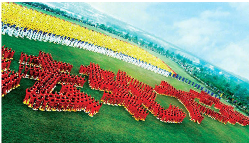
四川乐山，法轮功学员大型排字炼功

法轮大法是性命双修的功法。大法的法理直指人心，用人类最浅白的语言，讲出了宇宙间最精深的道理。修炼心性的同时，还有大圆满法的五套功法，按照宇宙演化原理修炼。五套功法内涵深奥，效果非凡，而又至简至易。新、老学员都炼同样的功法，修炼者可以达到相当高的境界。