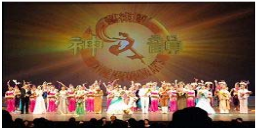
神韵全球上半年巡回演出在加拿大亚省省府圆满谢幕

2007 年元月 3 日当地时间下午 2 点，在加拿大温哥华市中心伊丽莎白女皇剧院，铜锣一声，2007 年“新唐人全球华人新年晚会”的首场演出开始。同年 5 月 16 日当地时间晚上 10 点，在加拿大经济大省亚省省府爱民顿市银禧剧院，神韵艺术团 2007 年上半年压轴演出缓缓落下帷幕。现场二千多名观众全体起立，献上最为热烈的掌声，经久不息。