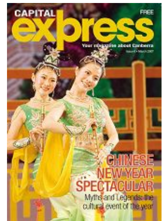
澳洲首都快报介绍神韵

文章还说，这家由纽约的电视台赞助的舞蹈团于四年前成立，并在全世界巡回演出。他们创作的舞蹈和音乐节目的灵感来自中国五千年的传统文化，目的是恢复人们对传统文化的关注。舞蹈取材于古老的中国宗教传说和神话，包括道家、佛家及儒家的教导。