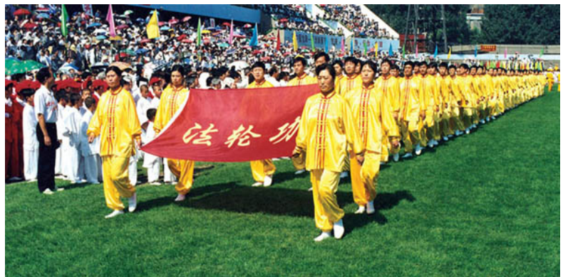
1998 年，中国沈阳，法轮功学员在亚洲体育节开幕式上列队入场

有关负责人在报告会的致谢辞中一再感谢李老师给当地民众、社会带来福音，并用最美好的语言预祝学习班圆满成功，并且对在废旧体育馆办这样高层次的学习班，人气这么兴旺，很感动也一再表示谢意与歉意，还当场知会所有参加学习班的学员在旧体育馆学习两天后，第三天一定会在新体育馆上课。