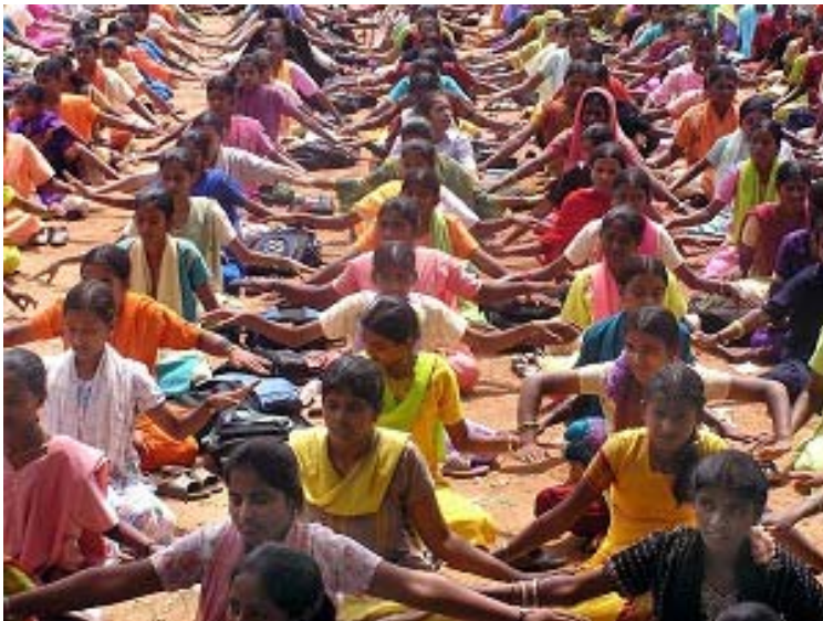
印度学生集体学炼法轮功

法轮大法是一种通过简单的动功和打坐改善身心健康的功法，最近在双子城越来越受到人们的喜爱。