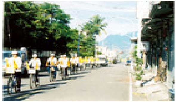
2003 年台湾学员声援大陆学员单车之旅经过台东

为了营救国内被迫害的亲人和同修，法轮功学员的足迹遍及欧、美、澳、亚四大洲。他们中有十几岁的少年，也有七十多岁的老人。日晒、风吹及种种困难，使每一个参加长途跋涉的学员都体会到了艰辛和劳累。可是，他们和每一个相遇的人微笑，他们的信念单纯而坚定。仅在镇压刚刚开始的头两个星期，仅是美国学员，就跑遍了世界 170 多个国家的驻美大使馆、各大媒体和美国国会山庄的几百个议员办公室。