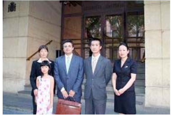
法轮功律师和证人在西班牙国家法院前

2005 年 12 月 5 日，监察冰岛政府行政运作的机构 Ombudsman 就 2002 年 6 月冰岛司法部利用“黑名单”阻止法轮功学员进入冰岛一事作出裁决：冰岛政府于 2002 年 6 月下令禁止法轮功学员入境及授权冰岛航空公司执行禁令的行为违法。