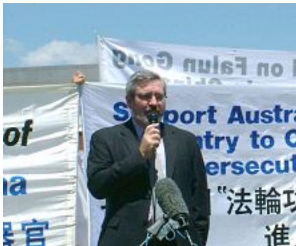
澳洲参议员安卓·巴雷特：我已做好进入中国准备

明慧网 2006 年 4 月 24 日讯，81 名美国国会议员联名致信美国总统布什，表示对最近曝光的中共未经本人同意活体摘取法轮功学员器官的指控严正关注。目前信件已经送交白宫。这 81 名国会议员呼