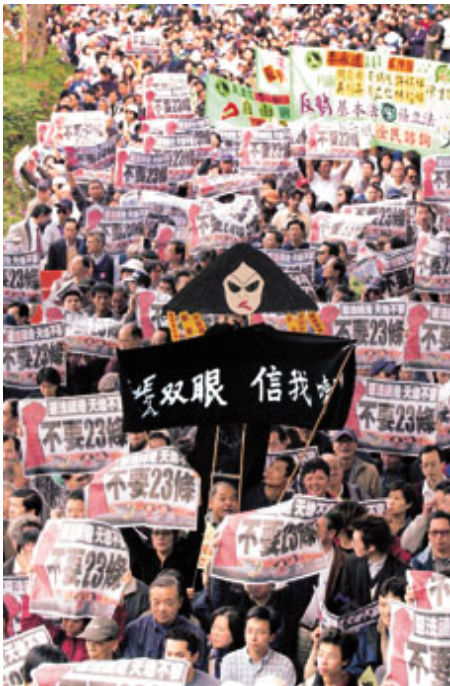
6 万港人参与反对 23 条大游行

“……我们认为，没有必要就第 23 条设立新的罪名，应该撤销目前的立法建议。据香港大律师公会说，香港特区现行法律已经足以禁止第 23 条列出的行为，无需设立新的罪名或根据第 23 条制定更多的法律。大律师公会也指出现行法律的许多部份已经过时，与《民权和政治权利国际公约》不符。因此，港府应做的是修改现行法律使之符合这项公约，而不是以国家安全为由制定新的罪名来限制香港人民的自由……”