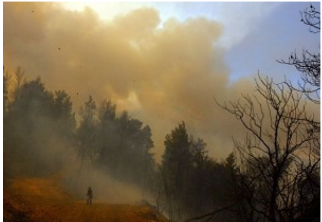
希腊大火失控，奥运圣火采集地化为焦土

自 2007 年 8 月 24 日开始，几十年来最凶猛的一场大火使半个希腊陷入了一片火海。希腊南部伯罗奔尼萨半岛的大火 26 日直逼奥运圣火的发源地——奥林匹亚古城遗址。古城遗址神奇般幸免于难，而每年奥运会举办前举行采集奥运圣火仪式的地方却被彻底烧毁。