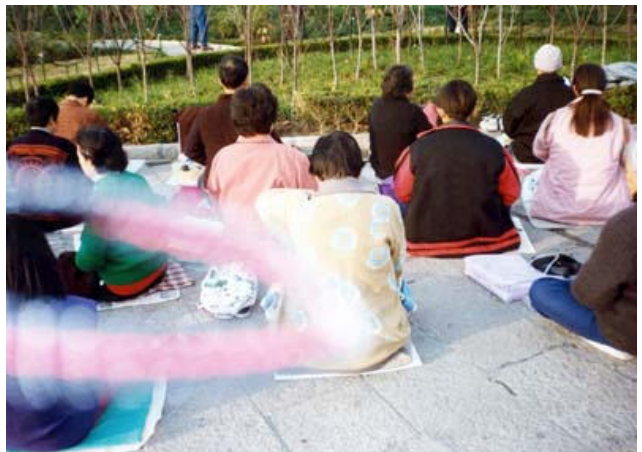
晨炼中的法轮串——旋转的能量流

我们走到半山腰时，从山上下来一位60多岁的老人，我认为是下山回家的，可是走到离我们十来米远时，突然回头又上山了。我们走他就走，我们停下照相他也停下，一直把我们领到庙里。山顶这个庙就一尊十多米的石佛，就一间房子，也没有人吃住的地方。进去后师父叫我们每人给石佛敬香，这时师父跟石佛站在一起合照一张像就下山了。这个老人也没下山，也不知住在哪里。