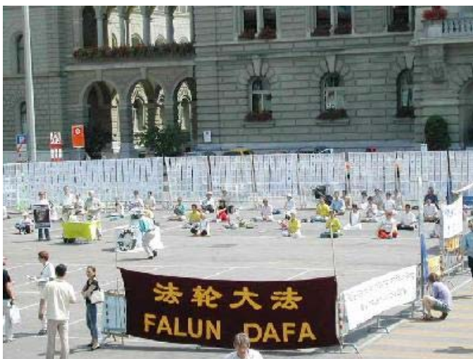
瑞士学员在伯尔尼广场展示“悼念墙”，要求追究迫害者责任

文章说，有人说“没有江泽民，就没有黄菊的今天”，这句话说得“经典”。没有江泽民，黄菊的确爬不了这么高，如此品性低劣的人，的确做不了政治局常委，主管不了全国金融、财政、税务，也就无法倾国家之财力帮助江泽民镇压迫害法轮功，最后落得如此的下场——活着受病痛折磨，生不如死；死后为万夫所指，遗臭万年。