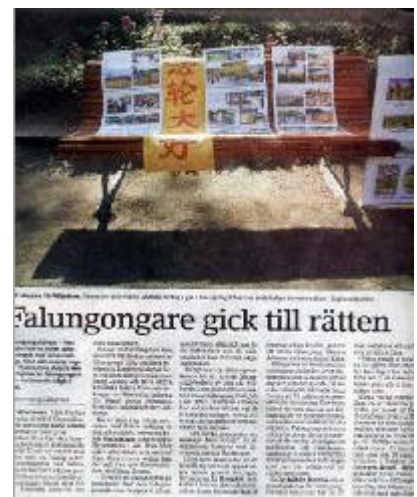
媒体报导法轮功讲真相活动