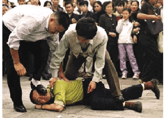
天安门广场非法抓捕法轮功学员

2002 年 8 月 27 日，中国河北省保定市徐水县出动多辆警车和大量荷枪实弹的武警追截播放法轮大法电视片的法轮功学员并开枪射击，法轮功学员乘坐的面包车被撞烂。6 名法轮功学员后被国家安全部逮捕。