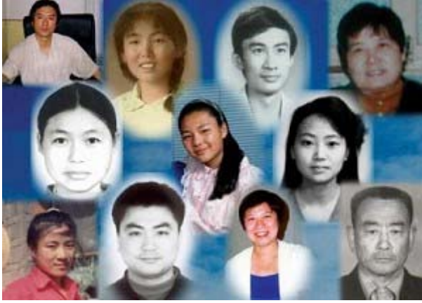
部份被迫害致死的法轮功学员照片

——2001 年公安内部透露，维持天安门搜捕法轮功学员的开销为一天 170 万至 250 万，合一年 6 亿 2 千万至 9 亿 1 千万元；