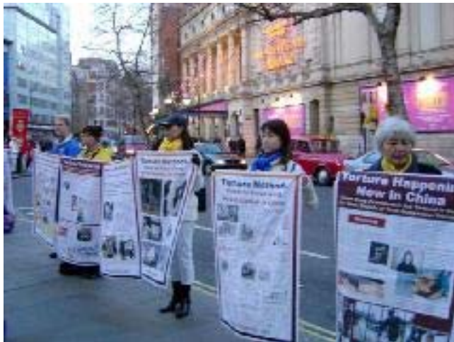
欧洲法轮功学员在伦敦市中心组成“勇气长城”

自由亚洲电台在 7 月 24 日的采访报导中说，来自美国和世界各地的 3000 多名法轮功学员在美国首都华盛顿的康狄涅克大街排成“勇气长城”，抗议中国政府取缔法轮功五周年，他们的队伍长达 3 华里，