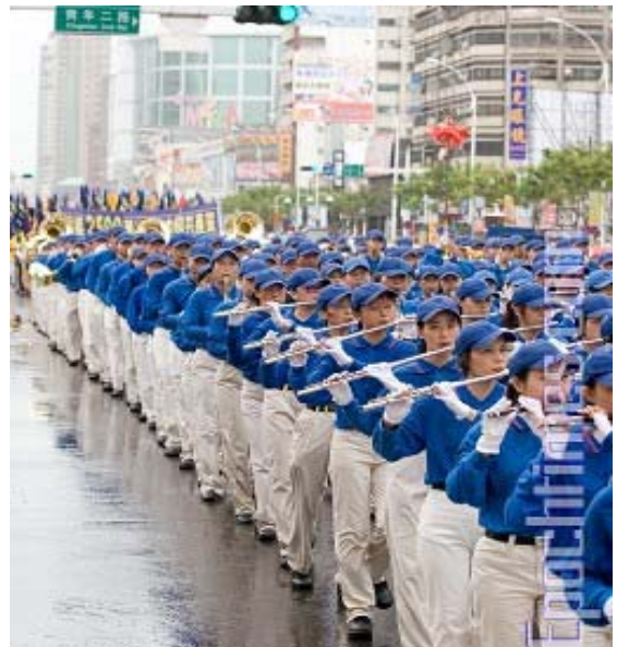
全球最庞大的台湾“天国乐团”

法轮功学员的表演，是游行队伍的压轴戏。司仪介绍了法轮功创始人李洪志先生，以及这个功法的一些特色。她说：“这个队伍来自社会的各个阶层，他们要将法轮大法‘真善忍’的美好讯息，带给在场所有的来宾。”