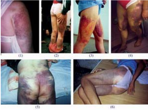
部份酷刑折磨的证据照片

据官方公开的数据，截至2002年7月底，仅广州市劳教场所就非法关押法轮功学员464人。2005