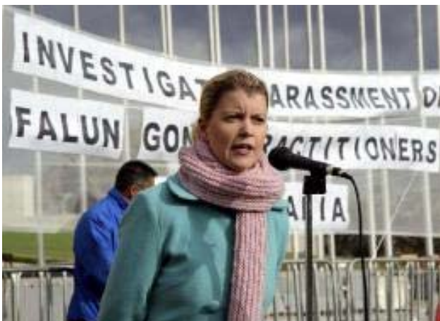
澳洲参议员黛斯帕佳呼吁保障法轮功学员不受骚扰

2003 年 1 月 20 日，“追查迫害法轮功国际组织”于美国成立，并宣布将“天安门自焚”事件列为第一个调查对象。