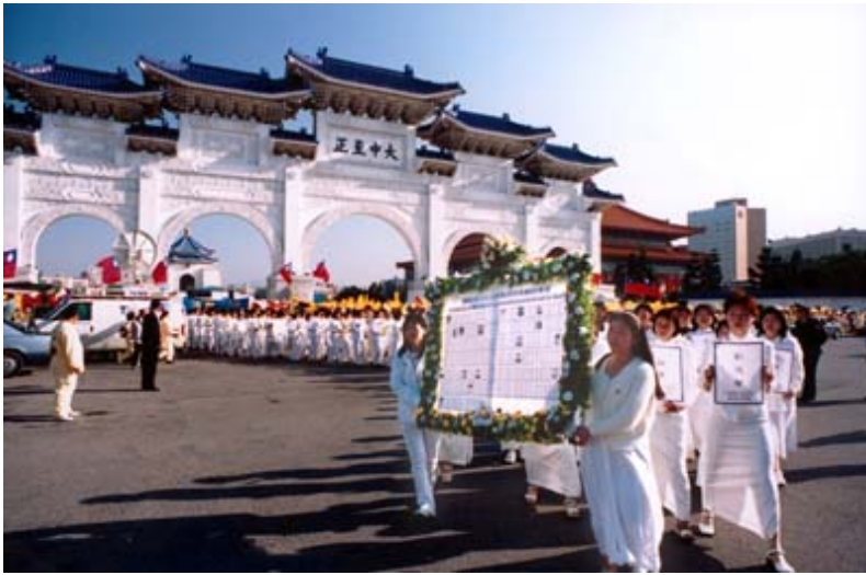
3000多名法轮功学员台北游行声援大陆同修

2000年3月20、21日，500余名世界各地法轮功学员于日内瓦联合国人权会议第56届年会开幕当天在联合国大厦外炼功、呼吁停止镇压并召开心得交流会和新闻发布会。