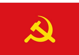
柬埔寨共产党党旗(1张)