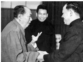
毛泽东接见英萨利（中间站者为波尔布特）

1971年底柬埔寨革命军粉碎高棉共和国政府的“真腊二号”军事行动，已取得战场上的主动。1973年8月美国飞机停止轰炸。柬埔寨革命军发展到5万人，解放了90%以上的高棉共和国国土，完全控制高棉共和国首都金边市外围地区。1975年1月1日柬埔寨革命军对高棉共和国发起总攻。1975年4月1日高棉共和国总统 朗诺 以去外国治病的名义离开高棉共和国首都 金边市 。1975年高棉共和国首都金边市挂起了白旗。柬埔寨共产党领导下的柬埔寨革命军取得了抗美救国战争的全面胜利，在世界上再创了一个农村包围城市成功例子。