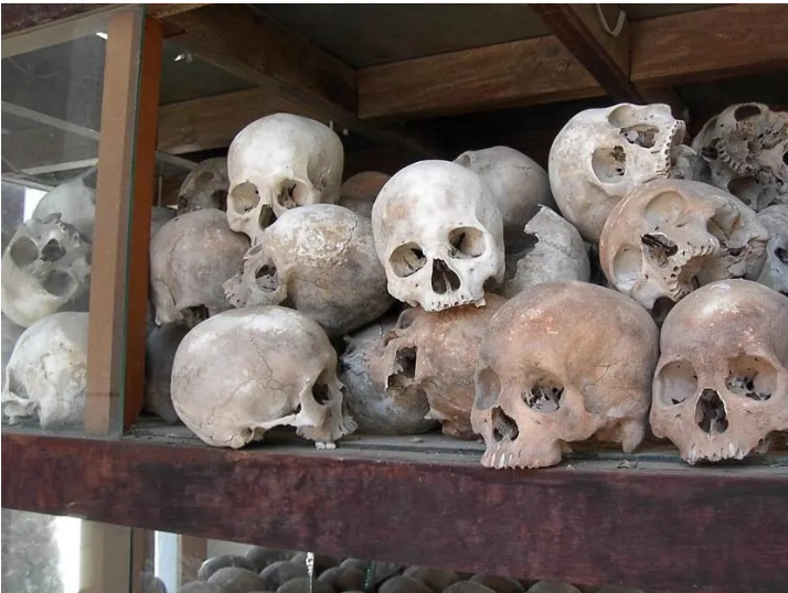
恐怖统治期间的受害者

民主柬埔寨对外也处在自我封闭状态。到1978年底除几个社会主义国家外，全世界只有埃及在这个国家派有外交人员。红色高棉认为革命后柬埔寨已进入社会主义革命阶段，要消灭各种差别，“在柬埔寨一举建成共产主义”。而红色高棉的“组织绝对正确”论和波尔布特在党内的绝对权威，使红色高棉的种种极端乃至残暴的政策得以实施。民主柬埔寨在其执政的四年时间里，柬埔寨至少有100万人非正常死亡，而当时柬埔寨总人口只有700万人。这是一场以社会重构为目的的民族和种族的大屠杀。所谓种族灭绝，是以1975-78年红色高棉统治时期总的死亡人口为依据的，虽然至今为止在这个问题上仍然有不同的估计，从保守的40万到有所夸大的300万。一般认为，100万是一个可以接受的估计。然而对于一个当时人口在700万到800万之间的小国来说，即使100万也是一个难以想像的数字，它远远超出了许多国家在新政权建立后的政治清算和镇压的规模，因而法国学者拉古特（JeanLacouture）把柬埔寨的这段历史称为“自我灭绝的屠杀”（auto genocide）。种族屠杀是指在柬埔寨的2万越南裔全部死亡，43万华裔死了21.5万，1万老挝裔死了4,000，2万泰裔死了8,000，25万伊斯兰教徒（Cham）死了9万，这些数字都超出高棉人死亡的相应比例。