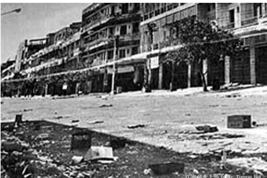
江南鳳凰上轉子 Pp. Tjessie.Net