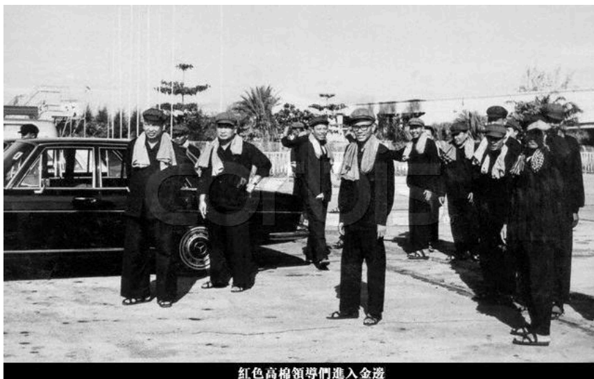
(柬共领导层进入金边)