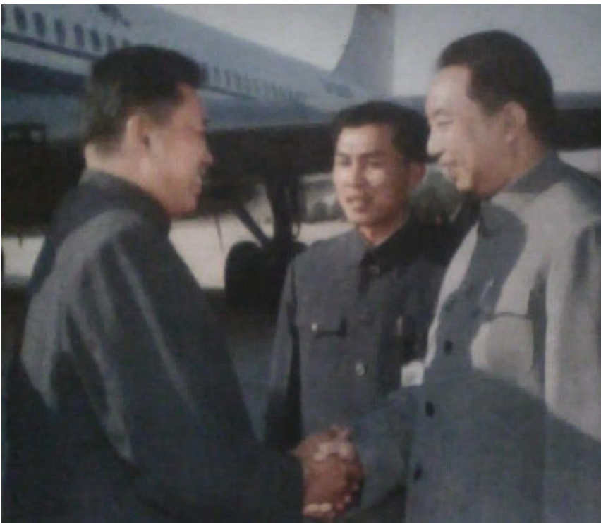
(华国锋亲自到机场迎接波尔布特)