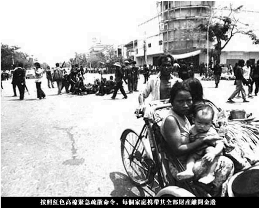
按照紅色高棉緊急疏散命令，每個家庭攜帶其全部財產離開金邊