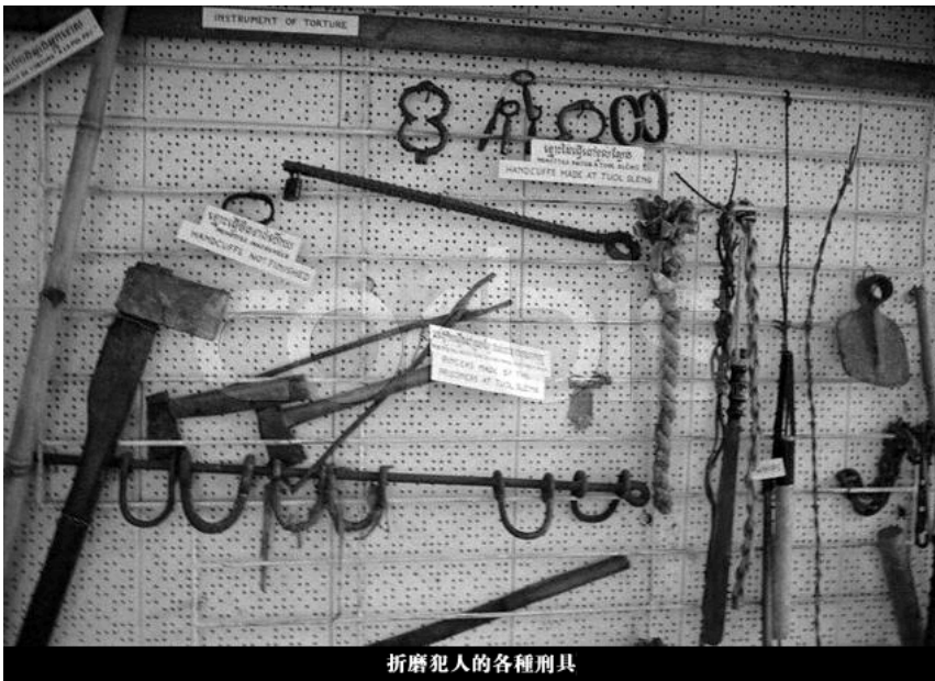
折磨犯人的各種刑具