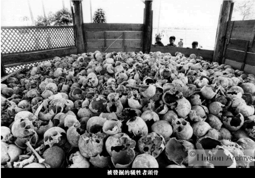
被发掘的牺牲者颅骨