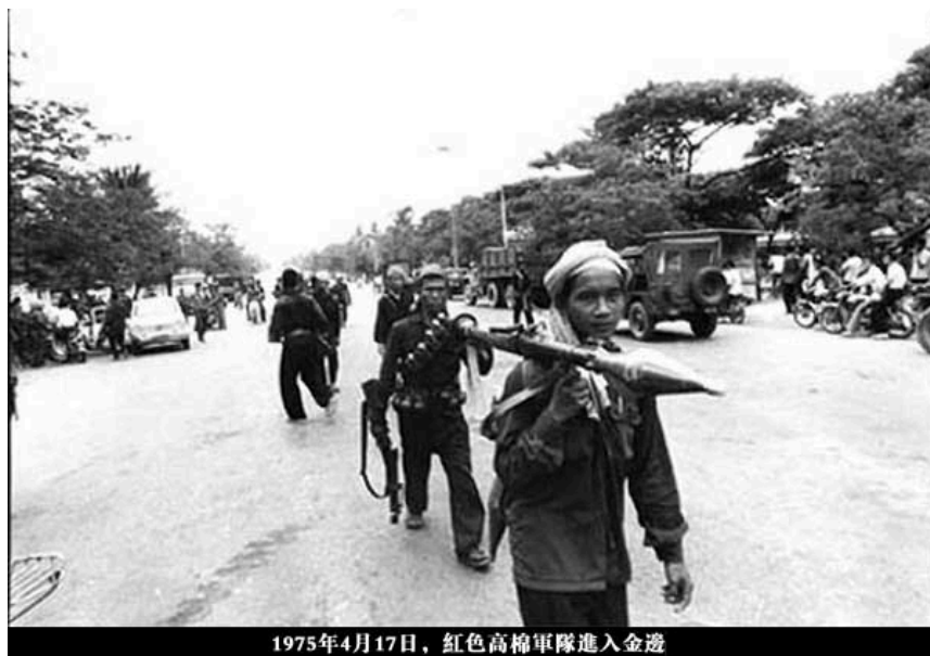
1975年4月17日，红色高棉军队进入金边

1976年1月，柬埔寨颁布新宪法，国家名称改为“民主柬埔寨”（简称“民柬”）。这时候的西哈努克国王，已经没有利用价值了。该年4月，西哈努克国王被迫退休，然后被软禁在王宫。