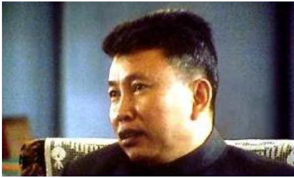
(年青时的波尔布特——光看照片难以想象此人是个恶魔)