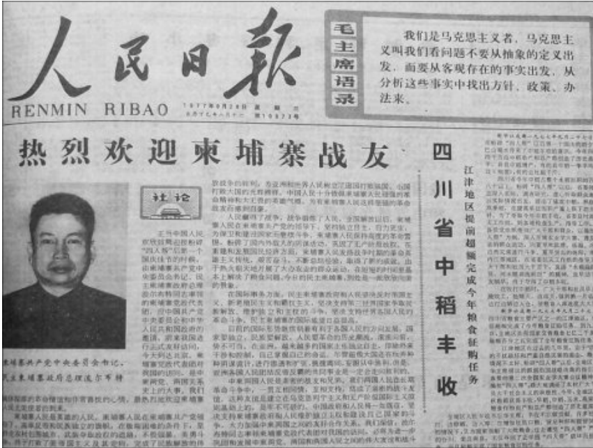
(波尔布特访华，上了《日人民报》的头版头条)

柬共干了这么多丧尽天良的事情，但是咱们天朝对他却一直大力支持。给大伙儿看几张照片，看完你就明白，中共政权是如何【力挺】红色高棉滴。