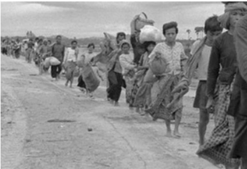
(民众从金边疏散时的情景)