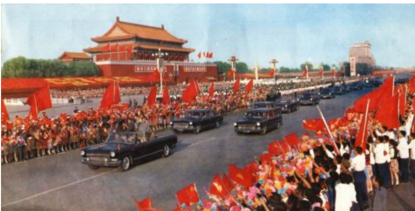
(北京长安街上盛大的欢迎仪式，华国锋和波尔布特站在第一辆汽车上)