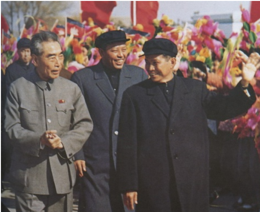
(丞相周恩来亲自去机场迎接波尔布特)