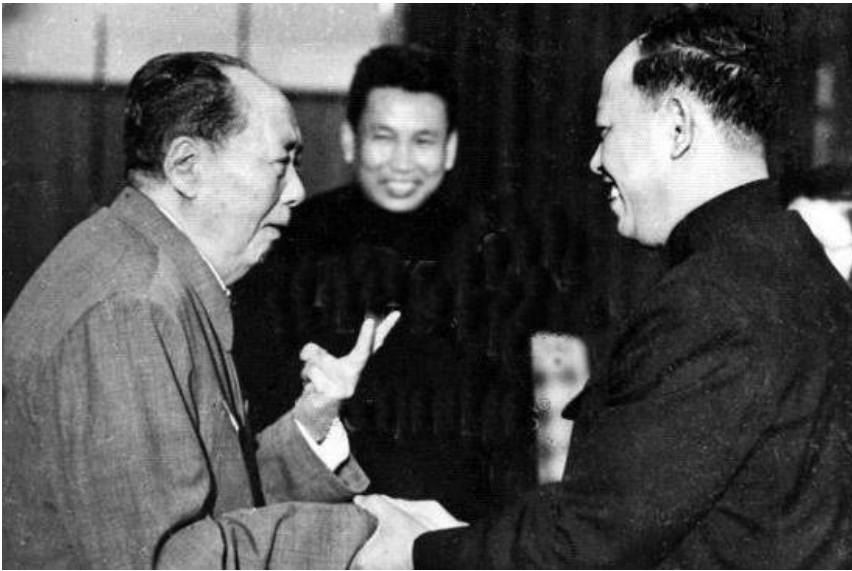
(毛腊肉与英沙里亲切握手，中间微笑的那位是波尔布特)