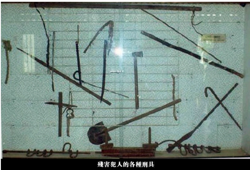
残害犯人的各種刑具