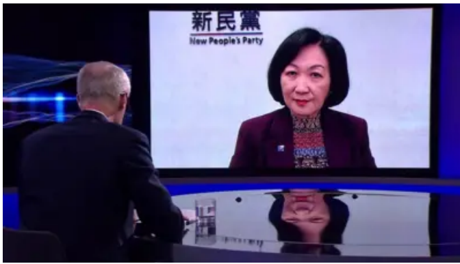
叶刘淑仪专访：2019年香港示威者试图推翻政府