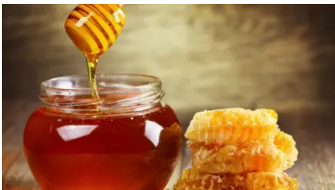
蜂蜜对人类有好处吗？