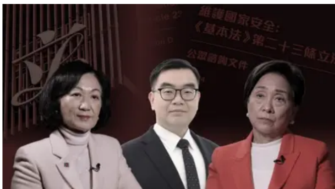
在香港讨论《基本法》第23条立法是否已成公众禁忌？