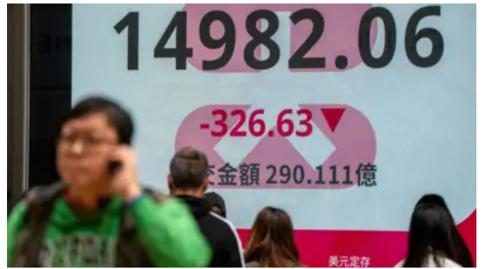
恒指再近历史低点 香港走向“国际金融中心遗址”还是寄望“由治及兴”