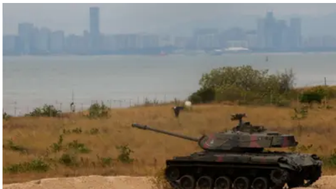
金门渔船翻覆事件余波未了 两岸海空界线默契逐步失效