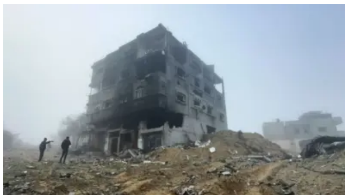
以色列有可能“消灭” Hamas 吗？