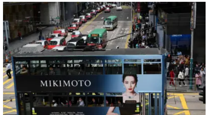
香港财政赤字连续第二年超千亿，全面撤“辣招”税救楼市