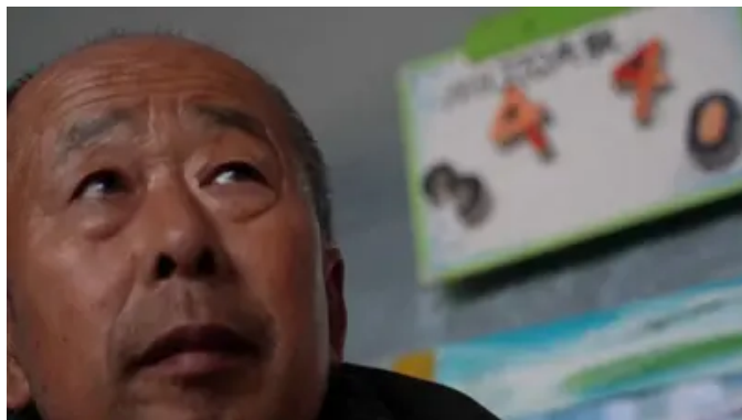
马航MH370失踪十周年：家属盼重启客机搜寻