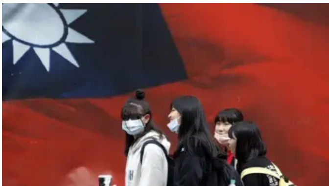
北京施压与台湾“断交潮”持续：民众有何看法？ 邦交国会否“清零”？