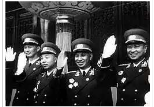
1955年国庆节，洪学智、萧华、粟裕、陈赓在天安门城楼

2013年2月1日，中共中央举行“纪念洪学智诞辰100周年座谈会”，贾庆林出席 [19] 。