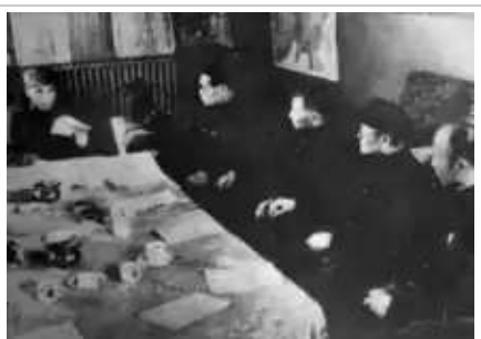
1946年，中共中央东北局扩大会议。左起：林彪、高岗、陈云、张闻天、吕正操

1941年5月，高岗任中共西北中央局书记 [1]:91 ，兼任西北局统战部部长、民族学院院长，负责西北地区党务，并具体负责陕甘宁边区政府和民众大生产运动。1943年，高岗兼任陕甘宁晋绥联防军副政治委员、代政治委员。1945年6月，高岗当选中央政治局委员。