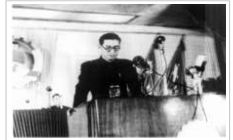
1949年9月21日，中国人民政治协商会议第一届全体会议上，高岗代表全中国解放区讲话

「高饶事件的实质是他们（高岗、饶漱石等人）试图把刘少奇和周恩来从中共的第二和第三的位置上拉下来。主要的目标是刘少奇。」 [11]:88 高岗夺权的关键因素是他对毛泽东态度的估计，「毛泽东在1953年初期与高岗的几次私下谈话中表示了这种（主要是经济建设和发展农业合作社方面）不满。不管毛泽东的意图是什么，高岗把这看成是一种信任他的信号和反对刘和周的机会。」 [12][13][11]:89