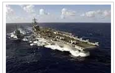
美國第七艦隊核心隆納·雷根號航空母艦