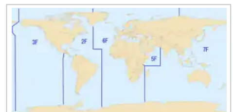
2007年美國海軍各艦隊管轄區域

雖然是美國海軍麾下戰力最強大的艦隊之一，但第七艦隊卻是美國最後一個只有配備傳統動力航空母艦的艦隊。之所以如此配置，主要的原因是艦隊主要駐紮地日本，乃是世界上唯一曾遭受美國核子武器攻擊的國家，日本人民普遍反對核子動力的武器，為了防止引起日本民眾反對，美方暫時配置了傳統動力航空母艦小鷹號作為第七艦隊的核心。然而，由於小鷹號已在2008年時除役，因此接任小鷹號除役後空缺的喬治·華盛頓號航空母艦，也順勢成為第一艘駐紮於日本本土的核子動力航空母艦 [8] 。喬治·華盛頓號於2008年至2015年駐紮於日本，之後返回美國歲修，由隆納·雷根號航空母艦接替。