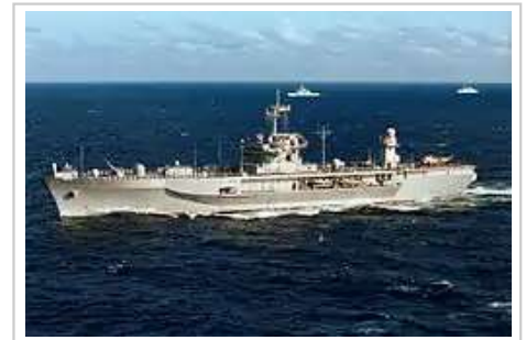
第七舰队旗舰蓝岭号两栖登陆指挥舰

第七艦隊另有數艘濱海戰鬥艦、數量不明的機動飛彈快艇等，駐紮於關島、中途島等美軍基地，用以平時巡衛用，如遇到盟國或友軍船隻、軍艦會協航甚至保護之。