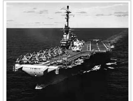
列星頓號航空母艦