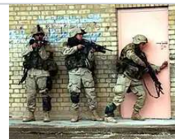
費盧杰第二次戰役中, 第1騎兵師的士兵準備進入建築物 2004年11月12日