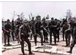
兩個遠程偵察巡邏隊 越戰