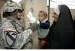
送一個玩具給伊拉克孩子 (執行醫療任務時)