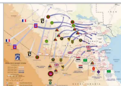
第一次海灣戰爭(沙漠風暴), 第1騎兵師參與的作戰計劃圖