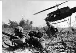
一架UH-1D直升機卸載步兵後爬升