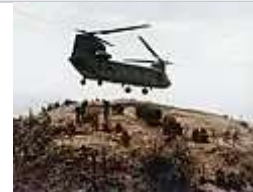
部隊從波音公司CH47-奇努克直升機卸載 越南 1967年