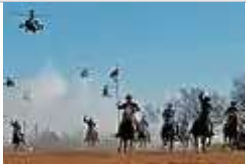
第一騎兵師的戰鬥航空旅與馬支隊進行模擬攻擊。