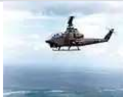
越戰時的貝爾AH-1G眼鏡蛇直升機