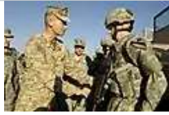
彼得·佩斯在伊拉克 2006 年12月