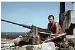
春節攻勢前的美軍 1968年1月27日