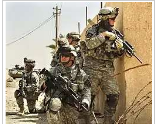
在巴格達巡邏的第2步兵師士兵