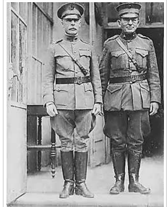
勒瓊准將和前任師長 - 陸軍少將歐馬·邦迪 ( ) 合影於1918年