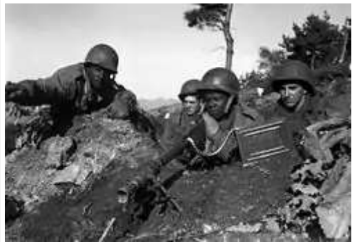
1950年11月下旬，清川江戰役中的四名第2步兵師士兵