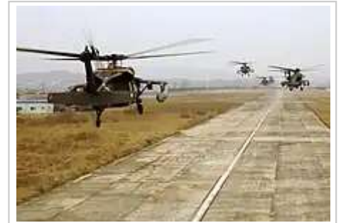
第2步兵師航空戰鬥旅駐韓國的UH-60黑鷹直升機進行2007年軍演