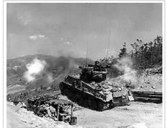
1952年，一輛在韓戰中對共軍陣地進行砲擊的M4雪曼坦克