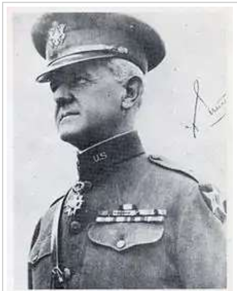
第2步兵師參謀長普雷斯頓·布朗准將穿著配有印地安人頭臂章的軍服，攝於1918年

1917年9月21日，美國軍方首次指定組建陸軍的新常備步兵師 [4] ，第2步兵師在同年10月26日成立於法國上馬恩省布爾蒙 [5] ，建師之初由三個旅級單位：陸軍第3步兵旅（含其下轄的第9步兵團、第23步兵團）、第4海軍陸戰旅（含其下轄的第5團、第6團及第6機槍營 [6] [7] [6] ）、一個野戰砲兵營和其他支援單位構成 [8] 。在一戰期間，第2步兵師兩度由美國海軍陸戰隊將官出任師長，分別為查爾斯·道恩准將（ ）和約翰·勒瓊少將（ ），這使第2步兵師成為美國歷史上首支由海軍陸戰隊隊軍官指揮的陸軍師團 [5] 。