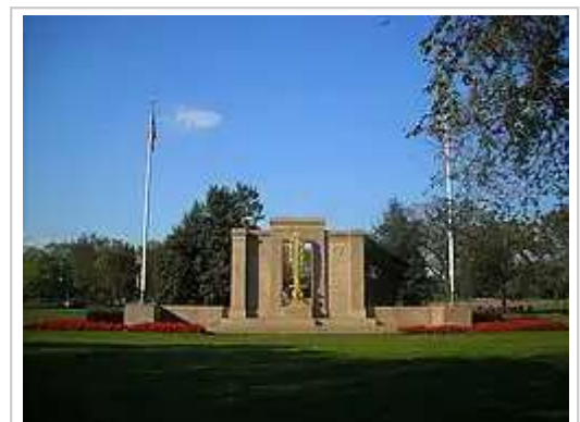
位於華盛頓特區總統公園內，落成於1936年的第二師紀念碑