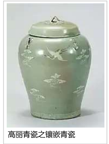
高丽青瓷之镶嵌青瓷

近代由于西方文化的冲击和日本的侵略，韩国陶瓷走向衰落。韩国光复后，首尔大学、梨花女子大学、弘益大学等高等院校纷纷陆续开始教授陶瓷课程。1955年，韩国在美国洛克菲勒财团的资助下成立了复兴传统陶瓷文化的首家研究机构——造型文化研究所。进入21世纪后，韩国在京畿道利川创建了陶瓷财团 [177] 。韩国每年以利川为中心举行世界陶瓷博览会 [178] 。