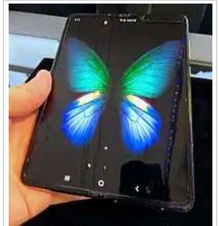
三星集团旗下的三星电子是全球最大的信息技术公司。 [75]

韩国是世界电子产品的佼佼者，内存、液晶显示器及等离子显示屏等平面显示装置和移动电话都在世界市场中具领导地位。世界知名的韩国电子产品制造商有三星、LG、SK等，其中三星是全球最大的信息技术公司 [75]。