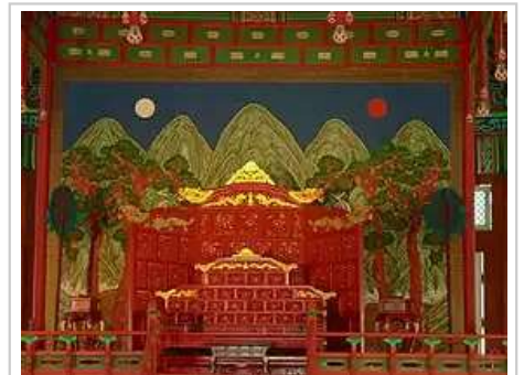
韩国景福宫勤政殿的御座和日月五峰图