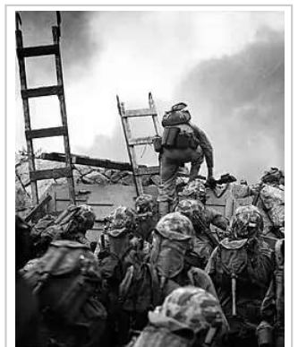
1950年9月，美國海軍陸戰隊登陸仁川，攻陷朝鮮佔領的區域