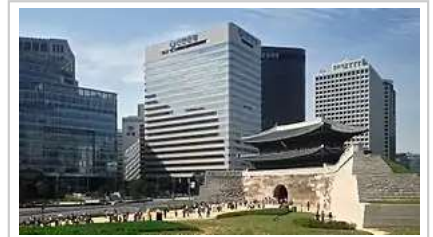
成立于1897年的新韩银行是韩国历史上的第一家民间银行，总部位于韩国首尔南大门旁边

韩国交易所（简称 KRX ）是韩国唯一的证券交易所，总部设在韩国釜山广域市，2005年1月由原韩国证券交易所（KSE）、韩国期货交易所（KOFEX）和韩国创业板市场（KOSDAQ）合并而成，其主要指数为韩国综合股价指数 [54] 。韩国交易所的证券期货及其它衍生产品交易量位居世界首位 [54] 。2010年，韩国交易所衍生产品合约交易量为37.52亿手，占全世界交易量的16.8% [55] 。据世界交易所联盟2008年的统计，韩国创业板市场KOSDAQ的成交量及换手率仅次于美国纳斯达克，其上市公司总市值位居世界第四 [54] 。