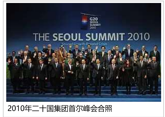
2010年二十国集团首尔峰会合照

朝鲜战争停战后，韩美签订《共同防御条约》。此后，美国在韩国驻军帮助韩国维护国防 [115]:183-185 。1994年12月1日，韩国收回了除战时指挥权之外的军事主权。驻韩美军由主导角色转变为支援角色 [115]:51 。1967年2月韩美签署《驻韩美军地位协定》后，韩国开始拥有对驻韩美军名义审判权。2002年2、3月以后，驻韩美军恶性犯罪引渡给韩国警方。韩国警方对杀人、强奸等恶性犯罪在逮捕嫌疑犯时可以持续拘留而不必先交给美军 [115]:186 。韩国作为美国的盟友先后参加了越南战争、海湾战争、阿富汗战争和伊拉克战争 [115]:83 。1991年以来，韩国开始积极展开以多国部队维和活动及国防合作活动为目的的海外派兵，先后向索马里、黎巴嫩、南苏丹等18个联合国任务团派兵13,000多名，为世界和平作出了贡献 [115]:83 。2014年12月，韩国国会国防委员会通过了《海外派兵法》，使韩国除“根据联合国安全保障理事会决议的维持治安及稳定、人道主义援助、恢复重建等活动外”，“获得联合国、多国联合部队或特定国家的邀请”也可以对外派兵 [115]:105 。