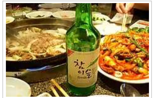
韩国料理与韩国酒

韩国人喝酒很讲究，要相互倒酒以表示友谊。为别人斟酒，一定要用右手拿瓶，左手要扶着右手，以示尊重。用左手斟酒被认为是不礼貌的。接受者也要双手捧杯，以示谢意。与中国人不断地为客人续酒有很大的不同，韩国人喝酒不喜欢续酒，而喜欢一杯喝完再倒。晚辈与长辈喝酒时，晚辈要先向长辈倒酒。在长辈先喝酒后，才能饮酒。饮酒时不能面对着长辈而要把脸稍转向左侧再喝。 [212]