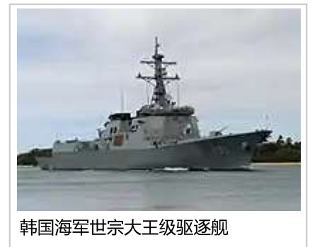
韩国海军世宗大王级驱逐舰