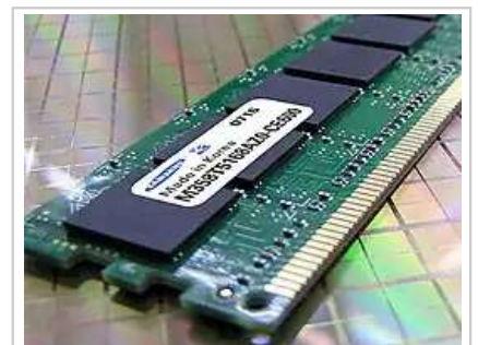
韩国三星电子是世界最大的储式半导体生产商

韩国是世界核能的后起之秀。2007年，韩国成为世界上第三个具备自行研发第三代核电技术的国家 [99] 。韩国核电一直保持着很高的运行效率，核电厂容量因子、平均功率损失率、非计划停堆率等指标世界领先 [100] 。2009年底，韩国力压美国、法国等世界老牌核电出口国，成功赢得阿联酋价值200亿美元的四座轻水核反应堆核电站建设合同，成为世界上第六个核电站出口国 [101] 。此外，韩国还致力于发展比核裂变能量更大，而且近乎零污染的核聚变发电技术。1995年，韩国投资3090亿韩圆（25亿人民币）建造了世界上第一个采用新型超导磁体材料产生磁场的全超导聚变装置KSTAR。2010年11月8日，KSTAR首次成功实现了等离子体约束状态的H模式。这是世界首次用超导热核实验装置实现H模式，对国际热核聚变实验反应堆（ITER）项目的进展起到非常重要的价值 [102] 。