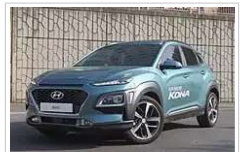
现代汽车生产的SUV Hyundai Kona