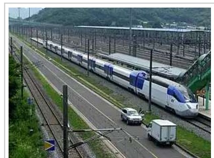
韩国现代Rotem生产的KTX-II高铁最高时速可达350公里 / 小时

截至2012年9月底，韩国铁路系统共有90条铁路线，总运行长度为3,569.5公里，其中复线1,904.4公里，电气化铁路2,385.2公里 [58] 。连接韩国主要城市的铁路运输由韩国铁道公社运营 [59]:438 。2004年，京釜高速线的开通开始了韩国的高速铁路时代。继日本、法国、德国和西班牙之后韩国成为世界上第5个拥有高速铁路的国家 [1]:247[60]:125 。韩国高速铁路（KTX）是韩国高速铁路系统的运营商。韩国高铁设定时速为每小时350公里，实际运行速度最高可达每小时300公里。从首尔至釜山乘韩国高铁仅需2小时40分。韩国高铁将高速公路形成的“一日生活圈”变成了“半日生活圈”，即半日内可到达韩国主要地区 [61][62] 。