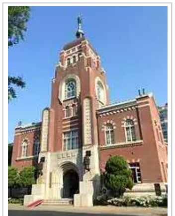
天道教中央大教堂