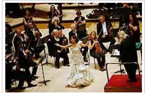
韩国女高音歌唱家曹秀美在英国伦敦演唱会现场

韩国当代音乐分为传统音乐和西洋音乐。传统音乐又称为“国乐”，主要包括唱剧、板唱和民俗音乐 [185]:384-386 。韩国第一个交响乐团是1945年9月成立的韩国交响乐团，之后又出现了首尔市立交响乐团（1957年）、KBS交響樂團（1956年）等交响乐团 [59]:245 。韩国乐坛有个著名的郑氏家族，包括“东洋魔女”小提琴演奏家姐姐郑京和、大提琴演奏家妹妹郑明和、世界级指挥家哥哥郑明勋。韩国女童大提琴家张汉娜在12岁时获得罗斯特罗维奇国际大提琴比赛大奖和当代音乐奖 [185]:386 。许多韩国音乐家比如赵成珍、梁仁模、崔夏英等先后在伊丽莎白王后国际音乐比赛、柴可夫斯基音乐比赛、萧邦国际钢琴比赛、帕格尼尼小提琴大赛、西贝柳斯国际小提琴比赛等国际音乐大赛中取得优异的成绩 [186][187][188] 。