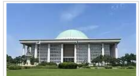
位於首尔永登浦區的国会议事堂

韩国国会具有立法权、修宪权、财政审查权、外交和战争权、人事权、监督权和弹劾权等权力，负责审议并通过或否决各项法案；审核和批准政府财政预算；检查政府工作；批准对外条约以及同意宣战或媾和；审核宪法裁判所所长、大法院院长、国务总理、检察长和大法官的任命；弹劾总统和主要政府官员、否决总统的紧急命令等。 [2]:30-31[4]:101-102[1]:70-71