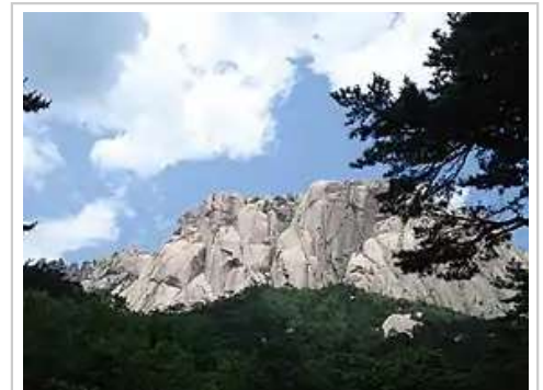
韩国雪岳山国立公园

韩国年平均降水量为1,500毫米左右，由南向北逐步减少 [31] 。受東南季风影响，夏季雨水多而集中，6月底至7月底有“梅雨”。6-8月的降雨量为全年的70%。南部沿海地区在夏末时常有台风。首尔的年平均降雨量为1370毫米；釜山1470毫米 [2]:12-13[4]:11[1]:5[29] 。