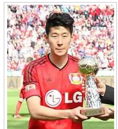
韩国足球运动员孙兴慜

足球是另一种在韩国广受欢迎的球类运动。韩国顶级足球联赛是K联赛，成立于1983年是亚洲最早建立的职业足球联赛 [219] 。目前韩国已经10次入选世界杯足球赛决赛周，自1986年开始至今再次入选后没有一届缺席过。2002年，韩国与日本联合举办了2002年世界杯足球赛，并取得殿军的成绩 [220] 。