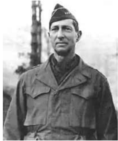
馬克·克拉克中將（時任美國第五軍團司令）