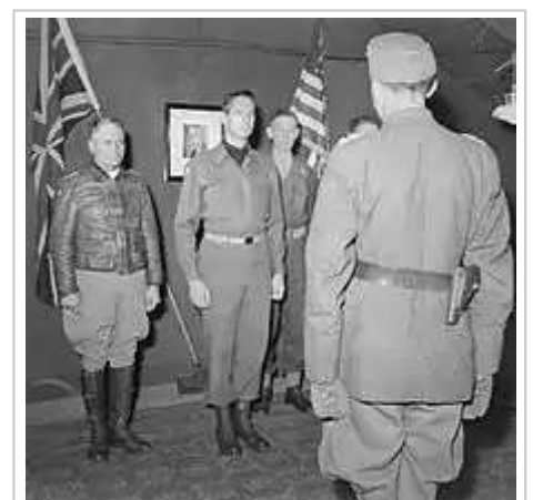
德國第14裝甲軍總司令馮·辛格爾·艾特林中將在第15集團軍總部與克拉克和下屬會晤，接受德軍在意大利無條件投降的指示。