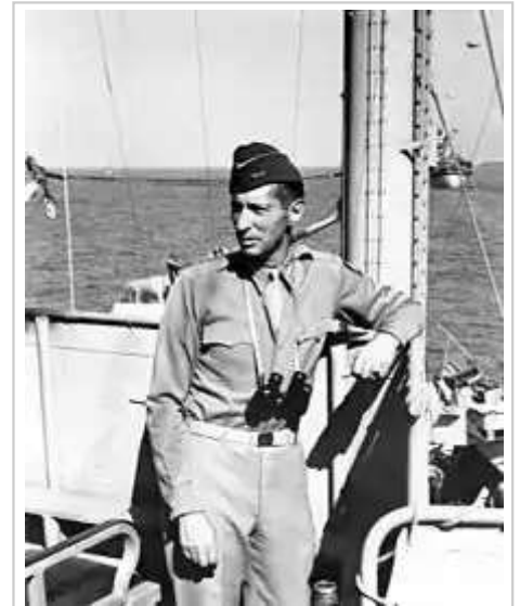
克拉克中將攝於兩棲艦隊指揮艦安肯號 (USS Ancon, AGC-4)，時間為1943年9月12日

當歐戰結束後，克拉克任美國駐奧地利的高級專員，並為美、英、蘇、法等四國占領軍的代表。1947年任美國國務卿的代表，與英、蘇兩國的外長會議協商對奧條約。1947年6月返美，前任司令部設於舊金山的第6軍團司令，兩