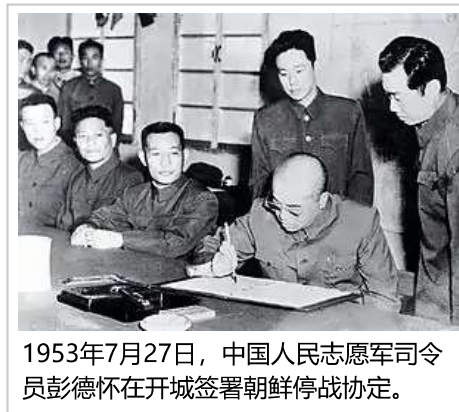
1953年7月27日，中国人民志愿军司令员彭德怀在开城签署朝鲜停战协定。