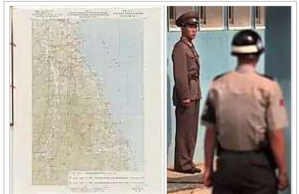
朝韩軍事分界線圖一之九