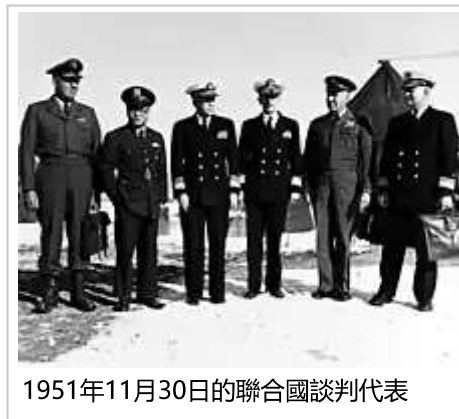
1951年11月30日的聯合國談判代表