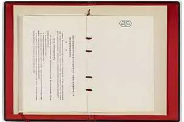
協定中文本正文第一頁

朝鮮人民軍最高司令官及中國人民志願軍司令員一方與聯合國軍總司令另一方關於朝鮮軍事停戰的協定