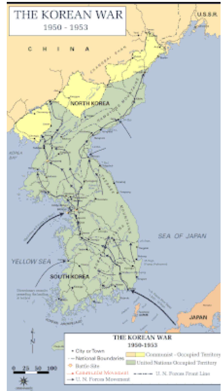
中國人民志願軍第二次战役