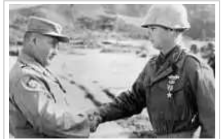
时任美第七步兵师指挥官韦恩·C·史密斯在1952年11月上甘嶺战役后为美军中尉汤姆·费尔南德斯颁发银星勋章