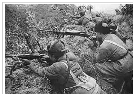
在三角高地防守的中国步兵班