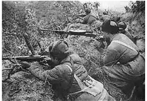
在上甘岭防守的一中队的中国人民志愿军士兵