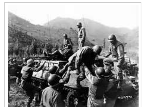
在第597.9高地的戰鬥後翌日，醫務兵協助料理美軍第31步兵團的傷兵

16-19日双方反复争夺，白天联军利用优势炮火夺取表面阵地后，志愿军在晚间利用坑道和后方兵力夺回。在19日凌晨的反击中，中国人民志愿军135团2营通讯员黄继光在爆破美军火力点的过程中，“在多处负伤，爆破器材用尽后”，用身体挡住了美军的射击孔。 [21][22] 黄继光阵亡后，被授予“中国人民志愿军战斗英雄”的称号，成为中国家喻户晓的英雄。