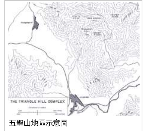
五聖山地區示意圖

第一天战斗，联军伤亡600人以上（美军31团伤亡433人，韩军第3营伤亡141人，第2营伤亡不详），参战4个营中3个营被迫撤下休整。志愿军伤亡500人以上，表面阵地全部被摧毁，储存弹药基本用尽。这一天的战斗中，美军首次为参战部队配发M-1951式防弹背心。