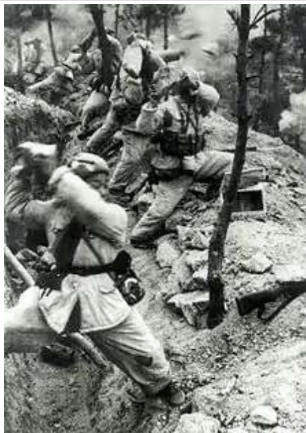
中國人民志願軍步兵在彈藥耗盡後向聯合國軍投擲石頭

棱线，志愿军1连转入反斜面坑道防守。美军则在战斗开始不久的手榴弹对攻战中损失了几乎全部军士长，至黄昏仍无重大进展。14日晚7:00，志愿军45师4个连反击，经过白刃格斗，将韩军击退，夺回狙击手岭。美军据称弹药不足，受攻击后，即退回出发阵地。