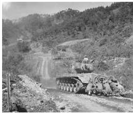
洪川郡一帶的美軍M26潘興戰車

抗美援朝第三次战役 ，中国人民志愿军介入朝鲜战争后的第三场战役。包括三七线附近的西线第三次汉城战役及东线原州战役。