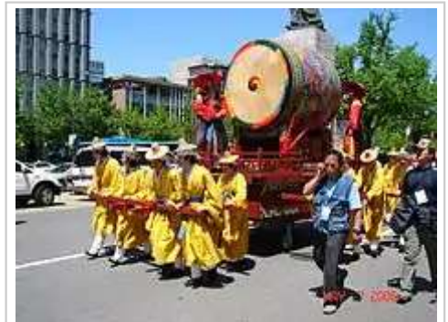
Hi! Seoul文化节的游行表演