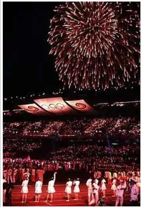
1988年汉城奥运会闭幕式

朝鲜战争爆发后，漢城在朝鲜人民军、中国人民志愿军和联合国军之间四度易手，遭到交戰雙方毀滅性的摧毀，昔日繁華的市區成為一片廢墟。光化門和政府大樓（前朝鮮總督府）建築遭到嚴重損毀，市政設施多數被破壞。朝鲜在漢城展开肃反活动，处决了大量韩国中央及地方政府官员、军官、警察、资本家、传教士、教授、记者等“阶级敌人”；韓國國軍随联合国军占领漢城之后也处决了大量共产党员和“亲共分子”。战前漢城原有人口180万，由于大量难民南逃，朝鲜方面在撤退时又将剩余人员带至北方，战后只剩6万左右。