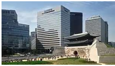
总部位于首尔南大门旁的新韩银行成立于1897年，是韩国历史上的第一家民营银行

首尔是亚洲的主要金融中心之一。韩国外换银行、韩亚银行、新韩银行、国民银行等银行的总部也设在首尔，其中新韩银行成立于1897年，是韩国历史上第一家民营银行。此外，国际性银行都在首尔设有分支机构。