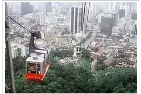
通往N首尔塔的南山缆车

著名的時尚購物中心為明洞、梨泰院、狎鷗亭洞。古董和特色商品集中在仁寺洞、黃鶴洞和長漢坪。南大門市場和東大門市場是最大的綜合貿易市場。