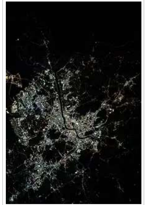
2019年从国际空间站拍摄的首尔及周边地区

汉江经八堂流入首尔后，河床变宽，形成广阔的冲积地，中央还形成了蠡岛、中之岛、汝矣岛、蓝芝岛等江心岛。除汉江干流之外，首尔的河流还有清溪川、旭川、佛光川、砂川等。首尔东北方的河流沿东大门区经道峰区，到京畿道议政府市，后经中浪川最终汇入汉江。安养川、炭川、良川等河流从首尔南部山区顺山势流下，最终注入汉江 [13]:244 。