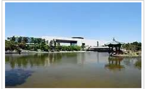
韩国国立中央博物馆

首尔是韩国的经济中心和亚洲主要金融中心之一，三星、樂金 (LG)、現代、起亞 (KIA) 集團和SK集团等大型跨国公司的总部都设在首尔 [25] 。虽然首尔仅占韩国国土面积的0.6%，但其GDP却占韩国GDP的21% [26] 。根据全球化及世界城市研究网络發佈的2016全球城市排名，首爾为Alpha - 级，與台北、深圳、新德里、廣州等同屬於Alpha - 國際三級大都會。首尔市内的物價昂貴，消費者物價指數世界第五，在亚洲仅次于东京 [27] 。首尔同时也是一个高度数字化的城市，其数字机会指数 (Digital Opportunity Index) 排名世界第一 [28] 。