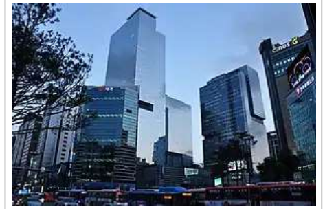
首尔瑞草区的三星城