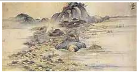
18世纪朝鲜绘画中的釜山

釜山海岸线和洛东江河口是韩国史前遗迹分布最广的地区。东三洞、多大浦、金谷洞等贝冢遗址的考古发现表明釜山地区在新石器时代就已经有人类居住 [6]:259 。这些新石器遗址出土的石器、陶器等生活用品以及吃过后扔掉的贝类、动物骨头等遗物表明当时的人类以捕鱼为生。釜山地区的内陆平地和丘陵地带存在着青铜器时期的遗址，其中以东莱区的青铜器时期遗址最多 [6]:256 。东莱区还发现有早期铁器时期的遗址和三国时代的古墓群 [6]:259 。