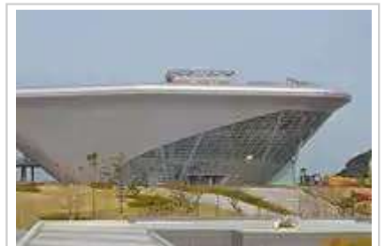
韩国国立海洋博物馆