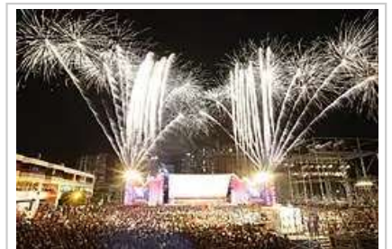
釜山国际电影节开幕仪式