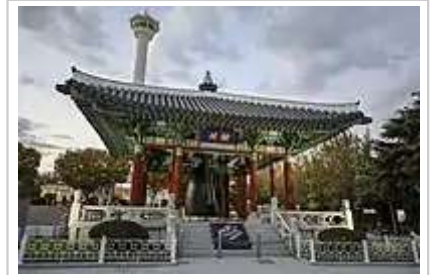
龙头山公园的钟阁