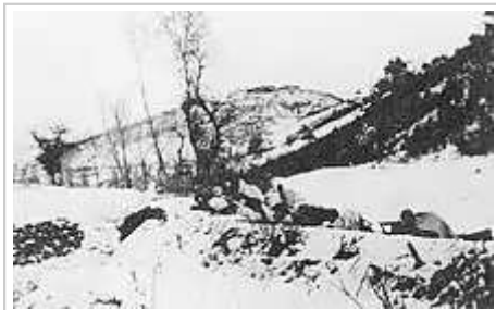
中國人民志願軍士兵設置埋伏攻擊撤退中的聯合國軍

在溫井戰鬥之後，中國人民志願軍司令部發現韓國第2軍是第8軍團中最脆弱的單位。 [42] 除了缺少和美軍一樣的火力支援外， [48] 還控制着聯合國軍右翼最困難的地形。 [42] 11月24