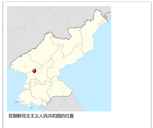
在朝鮮民主主義人民共和國的位置

儘管聯合國軍的空中偵察在11月27日發現在聯合國軍右翼的中國人民志願軍正迅速進入第8軍團的後方， [70] 沃克將軍仍然命令第8軍團其餘部隊繼續向北進攻。 [71] [72] 由於深信導致韓國第2軍的崩潰只是來自中國人民志願軍1次小規模的反擊， [72] 沃克將軍下令美軍第1和第9軍向東轉移，以支援韓國第2軍。 [73] 然而在這個時刻，美國第1和第9軍已經從中國人民志願軍在古姜洞、立石和龍山洞的反攻中遭受了慘重的損失。