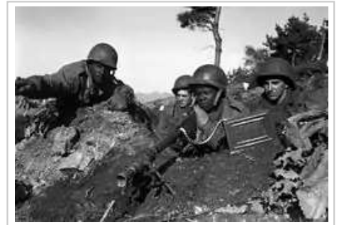
在1950年11月下旬行動中的美軍第2步兵師

由於聯合國軍先前在雲山戰鬥中戰敗，第25師預期在進攻中將遇到中國人民志願軍的強力抵抗， [99] 但中國人民志願軍前哨部隊隨著美軍進攻而撤退。 [104] 除騷擾性炮火外，第25師在進攻道路上並沒有遇到任何抵抗。 [105] 多爾文特遣隊在11月24日攻佔立石，幾個在雲山戰鬥中被俘的美軍戰俘在該鎮獲釋。 [104] 當多爾文戰鬥隊在翌日攻佔立石以北的山區