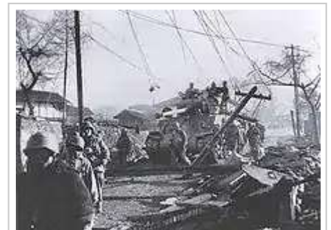
在聖誕節回家攻勢中，美軍坦克和步兵向北進攻

11月27日下午1時，彭德懷下令志願軍第66軍在韓國軍可以撤退到清川江前殲滅韓國第1師。 [133] 在11月27日晚上，志願軍第66軍對韓國第1師、美軍第24師第5步兵團和第35團展開大規模的攻擊。 [134] 午夜之後，中國人民志願軍的進攻突破了韓國軍的防線，攻佔了龍山洞並佔領了韓國第11團，第15團和美軍第35團的指揮所。 [135] 韓國第11和第15團隨後很快就潰散， [136] 而中國軍隊正在追擊的美軍第35團也被封鎖在龍山洞北面。 [137] 在沉重的壓力下，美軍第35團打穿了志願軍在龍山洞的防線，於11月28日下午與美軍第25師會合， [137] 同時，白將軍集合殘餘的韓國軍隊和收復龍山洞。 [136] 韓國第1師在中方的攻擊下一部堅守該城，直到11月29日退出戰鬥為止。 [138]