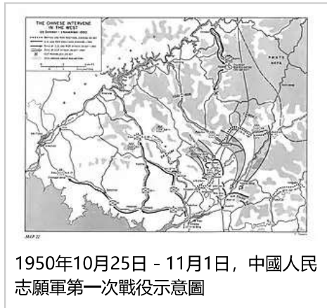
1950年10月25日 - 11月1日，中國人民志願軍第一次戰役示意圖

在1950年中成功在仁川登陸、击退朝鮮人民軍後，美國第8軍團越過三八線和迅速地向中朝邊境推進。 [17] 由於對這一事態發展感到震驚，毛澤東命令中國人民志願軍秘密進入朝鮮，並對聯合國軍發起第一次戰役。 [18] 在1950年10月25日至11月4日，中國人民志願軍第13兵團在溫井和雲山的一系列的戰鬥中