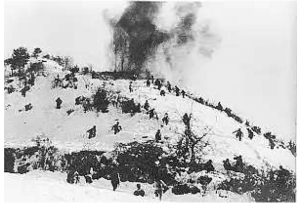
中國人民志願軍圍攻一處聯合國軍據點