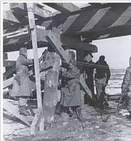
美軍作戰工兵拆除在平壤附近的1條橋樑以拖延中國人民志願軍的進攻

中國人民志願軍新的路障其中首當其衝的受害者是土耳其旅的1支車隊，並在11月28日夜間遭到伏擊， [174] 美軍第2師派出1支憲兵巡邏隊前往偵查，結果被擊潰。 [175] 當軍隅里的戰鬥仍然激烈，第2師師部在11月29日9點前確認了志願軍在其南方設立了路障。 [175] 凱澤將軍派遣偵察連和第9團的殘餘驅逐中國人民志願軍，但在1個坦克排的支援下美軍仍然無法掃除路障。 [174] 隨著軍隅里的戰役在11月29日晚上結束，志願軍第112師與第113師會師 [176] ，路障已發展至縱深6英里 (9.7) 長。 [177]