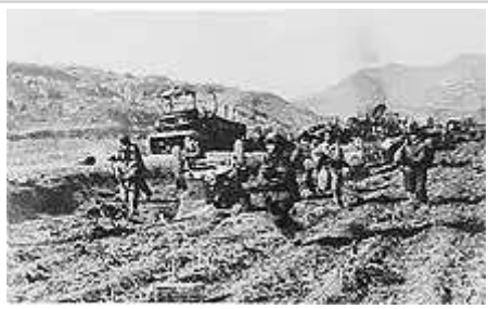
中國人民志願軍第39軍的士兵正追擊美軍第25步兵師

時， [106] 中國人民志願軍的抵抗開始變得頑強。 [107] 在11月25日下午的山區戰鬥中，多爾文特遣隊的第8軍團遊騎兵連在中國人民志願軍的防禦戰中遭受了重大損失， [108] 特遣隊在黃昏時停止進攻。 [107]