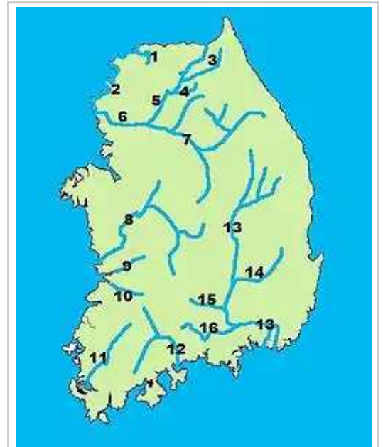
韩国主要河流分布图