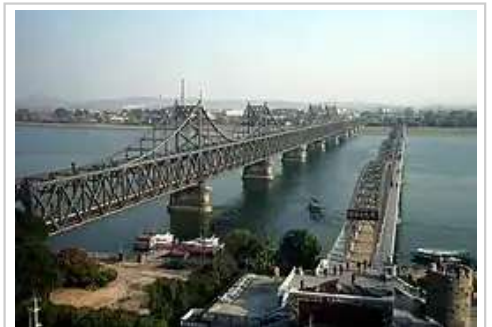
横跨鸭绿江的中朝友谊桥（左侧）