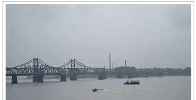
位于辽宁省丹东市的鸭绿江大桥