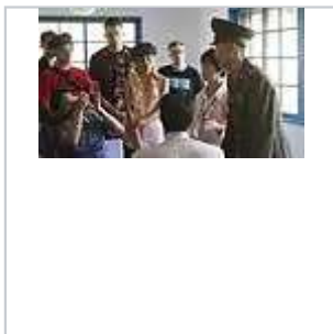
西方人在北韓一側會議室觀光