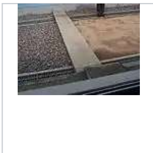
軍事分界線，右側為朝鮮領土，左側為韓國領土