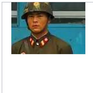
會議室外的朝鮮人民軍衛兵