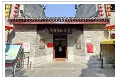
南宁邓颖超纪念馆