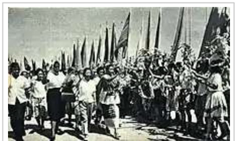
1965年邓颖超率队访问坦桑尼亚