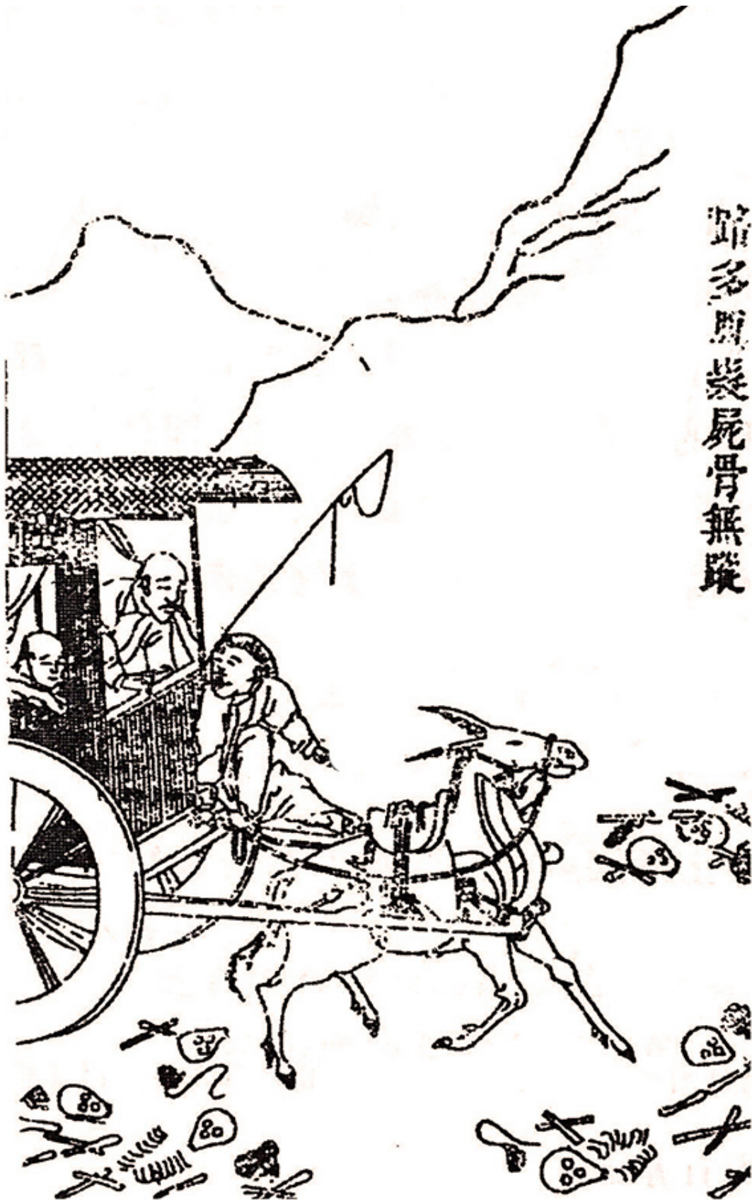
《晋灾泪尽图》，这幅是「路多风发，尸骨无踪」。

光绪五年统计，山西蒲、解、绛、平四县幸存者不过十分之三。垣曲、河津县仅存十分之一。