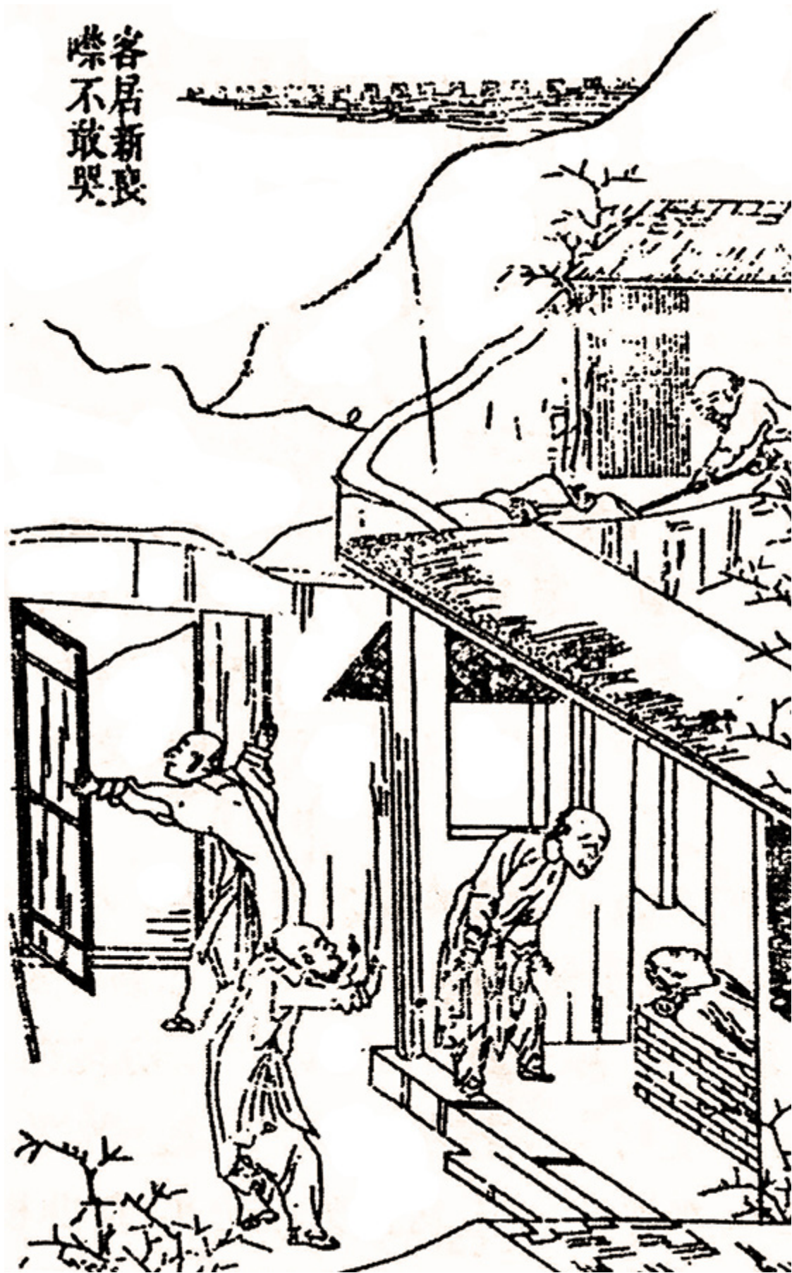
《晋灾泪尽图》，这幅是「客居新喪，噤不敢哭」。