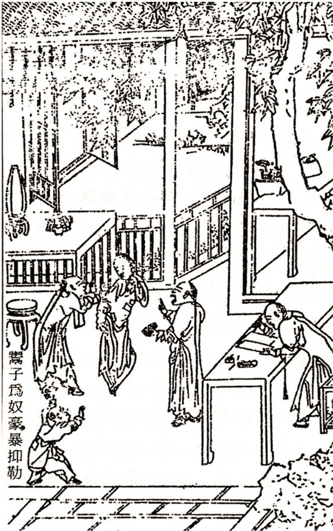
《晋灾泪尽图》，这幅是「鬻子为奴，豪暴抑勒」。

永和县志上说，「青年妇女无人顾养」，有外来商贩收买，「佳丽者不过干钱，稍次者不值一文，人命不如鸡犬」。