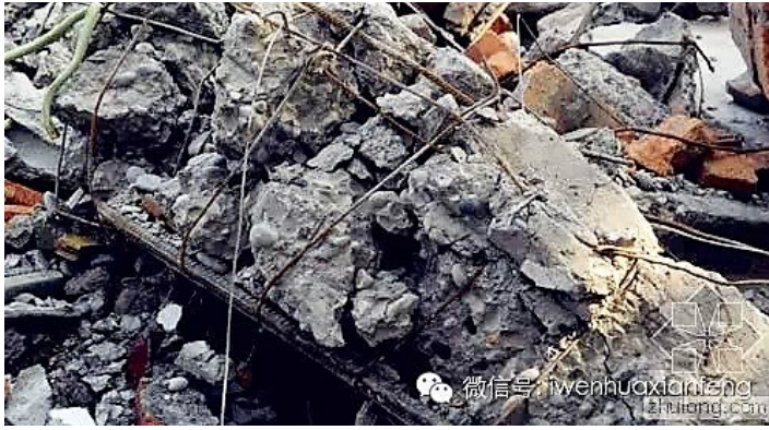
学校倒塌楼房的所谓钢筋水泥