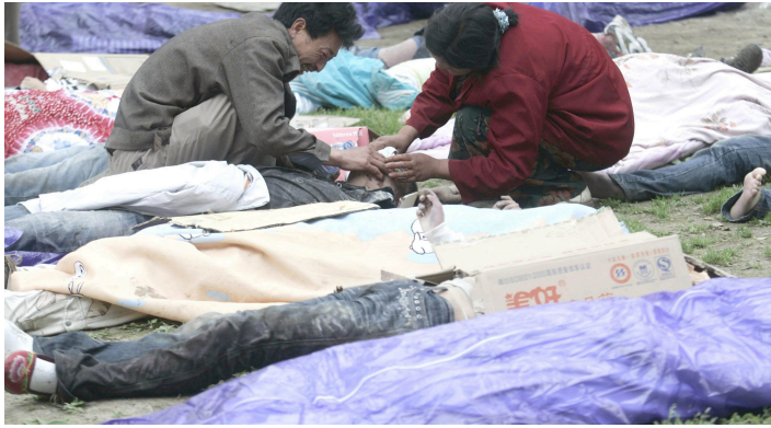
孩子，闭上眼睛，好好走吧。