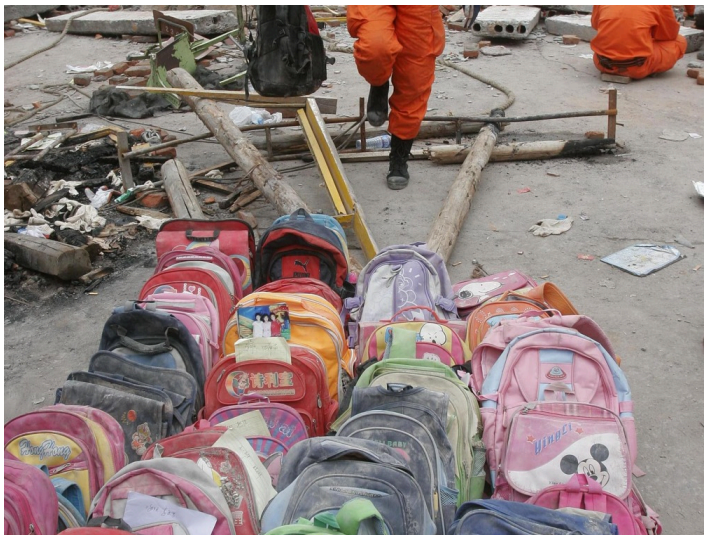
搜救人员找到的孩子们的书包