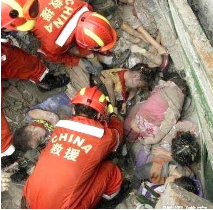
那一刻，孩子们躲在一起。

这是一个小小的女学生的尸体。僵硬肿胀的手中还紧紧握着一支笔。父亲说，他们穷，但女儿很懂事，学习异常刻苦。地震时女儿正在读书，她临死时手也不离笔。