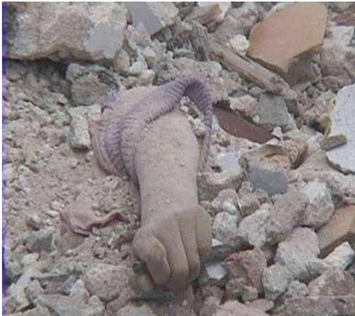
罹难学生手上还紧握着一支笔

这是一个小小的女学生的尸体。僵硬肿胀的手中还紧紧握着一支笔。父亲说，他们穷，但女儿很懂事，学习异常刻苦。地震时女儿正在读书，她临死时手也不离笔。