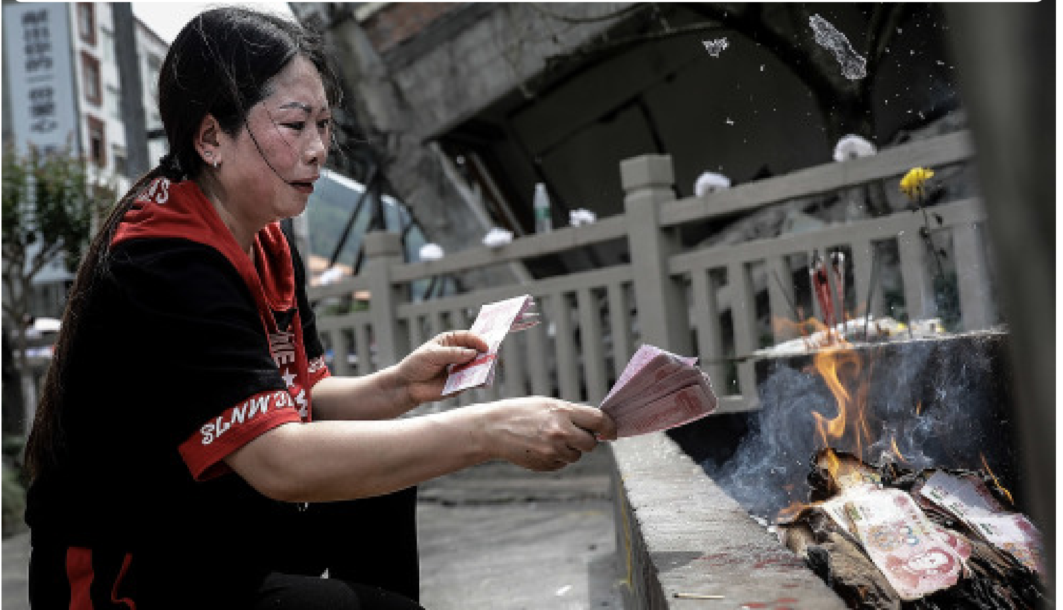
遇难学生家长悼念孩子。