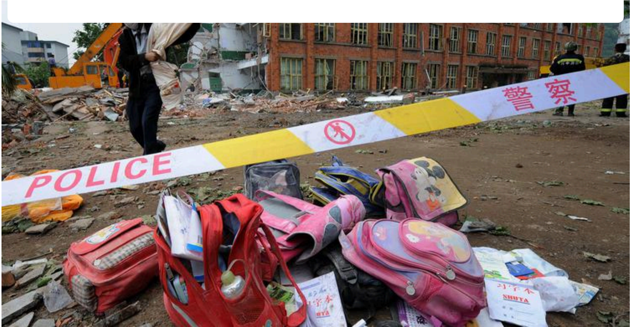
四川省汉王镇一所小学倒塌

为了平息社会风波，中共当局发布了所谓的调查报告称，地震灾区不存在“豆腐渣工程”，并称此次地震震级高、强度大是造成校舍倒塌的最主要和最重要原因。