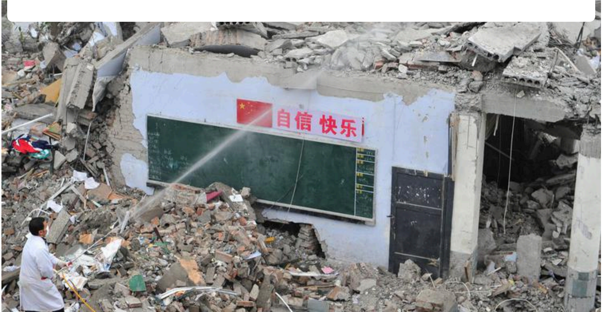
四川都江堰市聚源中学在地震中被夷为平地

遇难人数最高的是汶川县、北川县和绵竹县，分别为15,941人、15,646、11,117人。