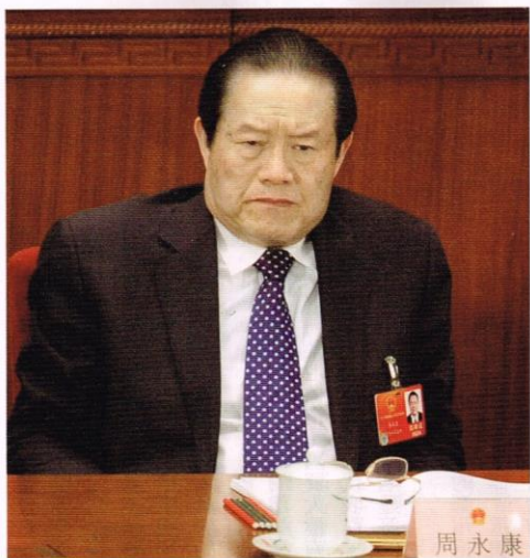
掌握中國法政的周永康權傾一時，後被習近平鬥下台。