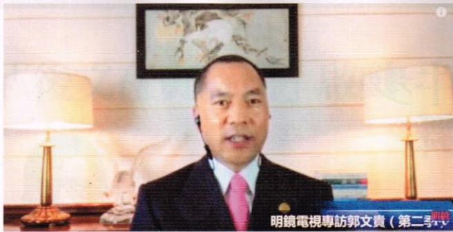
郭文貴在海外媒體爆料，震動北京政壇。